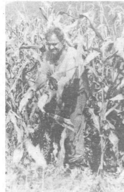
Lepi septembrski dnevi so tudi Želimelčanom prišli prav za spravljanje koruze

Hitreje kot pri cesti, pa se je v Želimljah premaknilo pri vodovodu. Krajanji so lani sami pljunili v roke in voda iz novega gravitacijskega vodovoda je pritekla praktično v vsa gospodinjstva (skupaj