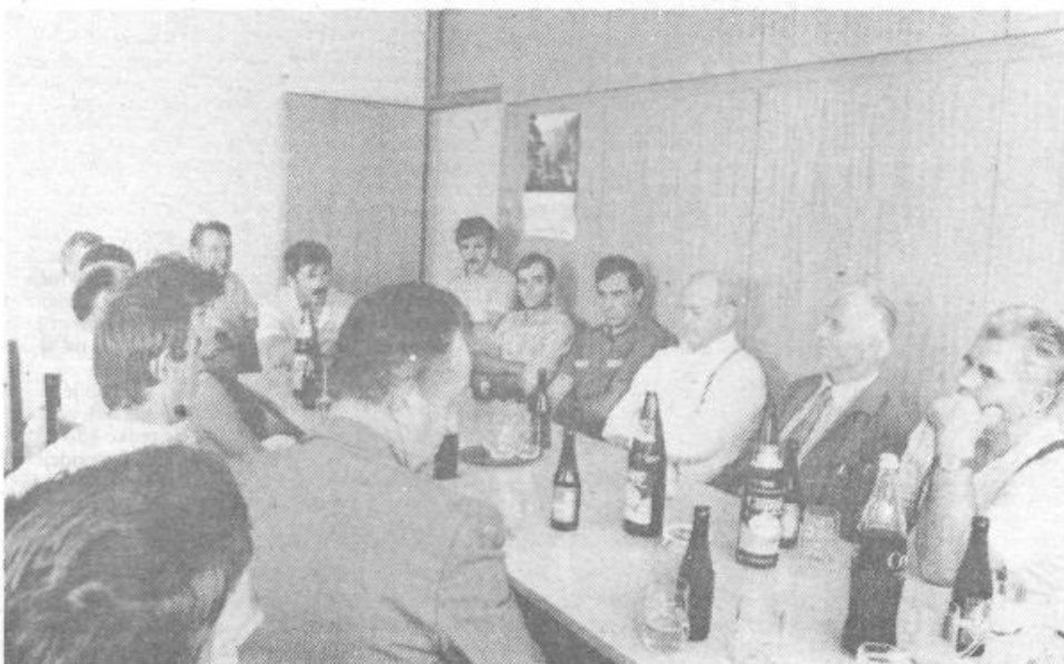
Med pogovorom v sejni dvorani KG »Zadruga« v Pliberku