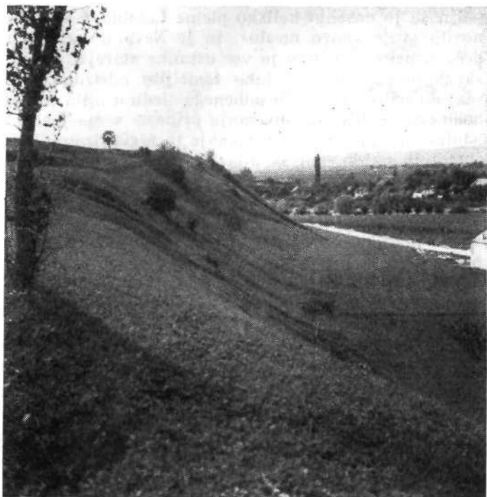
Gradišče pri Vel. Malencah

Upamo, da Muzejskemu društvu v Krškem nikdar ne bo grozila ta nevarnost in da se bodo vedno našli ljudje, ki bodo z veseljem in z navdušenjem delali na polju domoznanstva.