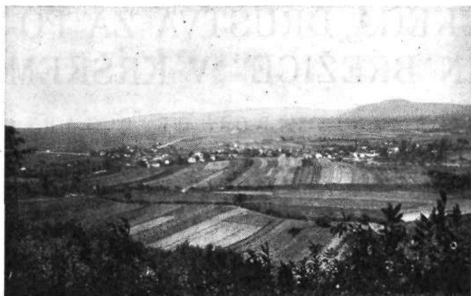
Pogled na Gradišče pri Vel. Malencah. V ozadju Krško polje, kjer leže razvaline Nevioduna

skega društva v Krškem bo prevzem varstva nad tem zgodovinsko tako važnim spomenikom. Najbolj ohranjena so bila vrata proti jugozapadu. Nameravano je bilo konzerviranje vrat, ali manjkala so sredstva. Zemljišče, na katerem stojijo, je že lastnina Narodnega muzeja v Ljubljani.