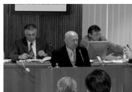
Z rednih sej Državnega sveta v letu 2006 stran 7