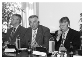
Državni svet na mednarodnem prizorišču stran 2 (spodaj)