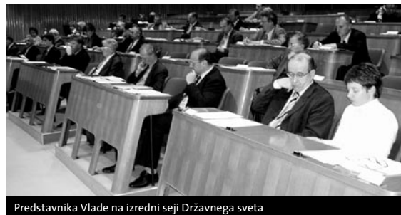
Predstavnika Vlade na izredni seji Državnega sveta

Državni svet je na izredni seji 29. novembra sprejel odločilni veto na novelo Zakona o odpravljanju posledic dela z azbestom. Cilj predlagateljev novele je bil, da se dopolni Zakon o odpravljanju posledic dela z azbestom z okoljskim in ne samo s poklicnim vidikom azbestnih bolezni, kar je med drugim zahteval tudi Državni svet, ki je na zakon vložil odločilni veto že marca 2006. Zakon se omejuje le na osebe, zaposlene v gospodarskih družbah, ki so predelovale, skladiščile azbest, in osebe na delovnih mestih, kjer so bile izpostavljene azbestu, zato je predlog razširil uporabo zakona tudi na osebe, ki so živele v okolju, v katerem so zbolele zaradi izpostavljenosti azbestu. Vendar pa so se pravice iz prvotnega predloga omejile le za osebe, ki so zbolele za mezoteliomom. Zato je Državni svet poudaril, da mora zakon določiti pravico do predčasne upokojitve, ki bo vezana izključno na verificirano bolezen zaradi izpostavljenosti azbestu. Zaradi vplivov delavčevega delovnega okolja se namreč pri azbestnih bolnikih bistveno poveča verjetnost, da obolijo za rakom na pljučih. Pravico do ustrezne odškodnine je treba z zakonom zagotoviti tudi zakonitim dedičem prizadetih oseb. Prav tako je po mnenju Državnega sveta nujno uzakoniti register delavcev, izpostavljenih azbestu, ki bo nudil dobro podlago za zgodnje odkrivanje azbestnih bolezni pljuč. Državni svet ponovno poudarja, da morajo biti pravice enake za vse upravičence, ki so zboleli zaradi izpostavljenosti azbestu.