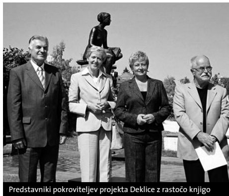
Predstavniki pokroviteljev projekta Deklice z rastočo knjigo