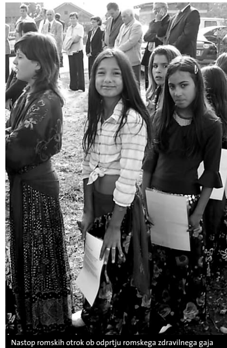
Nastop romskih otrok ob odprtju romskega zdravilnega gaja

države. /.../ In prepričan sem, da se bodo ta prizadevanja še nadgrajevala v razvojna partnerstva na različnih področjih - kot na primer na gospodarskem in izobraževalnem področju, kjer pa tudi že tradicionalno poteka letni mednarodni romski tabor Kamenci, ki je namenjen enakopravnemu interdisciplinarnemu vključevanju mladih Romov v družbene in izobraževalne procese.«