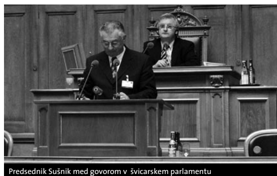
Predsednik Sušnik med govorom v švicarskem parlamentu

Prav tako Državni svet na izredni seji 2. junija ni podprl predloga odločilnega veta na novelo Zakona o medijih. Predlagatelji odločilnega veta so v svoji zahtevi izpostavili vprašanje popravka in 21. člena, ki govori o zaščiti pred potencialnimi škodljivimi medijskimi vsebinami. Smiselno bi bilo razrešiti vprašanje razlikovanja med odgovorom in popravkom ter razlikovanja med pravico do odgovora in pravico do zahteve po popravku. Tako bi bilo mogoče preprečiti morebitne zlorabe pravice do popravka.