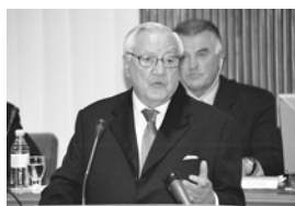
Pomen in vloga dvodomnosti stran 2