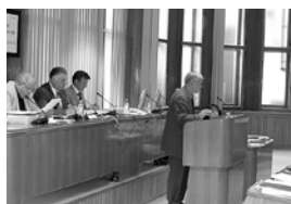
Premišljena odločnost Državnega sveta v letu 2006 stran 4