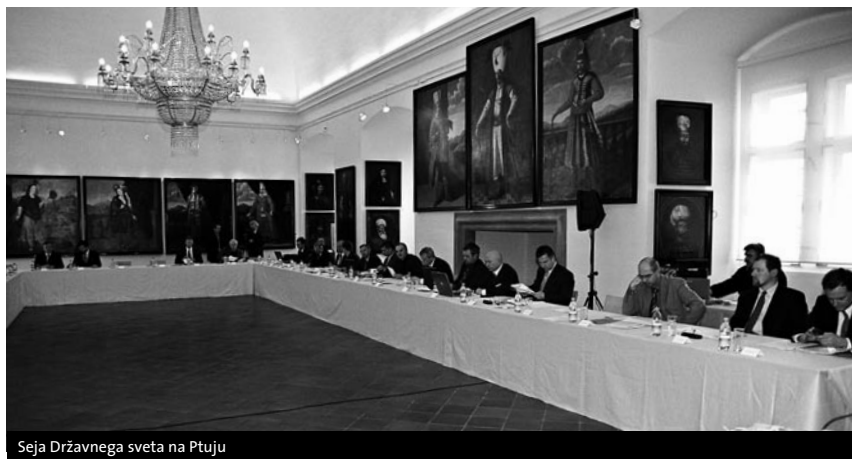
Seja Državnega sveta na Ptujju