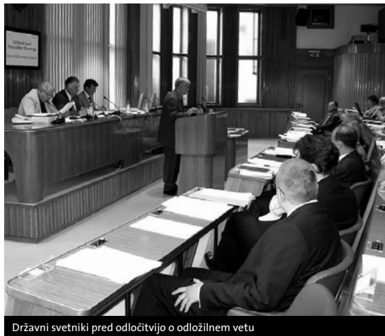
Državni svetniki pred odločitvijo o odločilnem vetu

se mu dosedanja izbira ravnateljev zdi sporna. Državni svet dvomi, da bo zmanjšanje števila zaposlenih v svetih zavodov privedlo do izbire kakovostnejših ravnateljev. Politična motivacija lahko ob spremenjeni sestavi svetov zavodov strokovna merila pri izbiri ravnateljev potisne v ozadje.