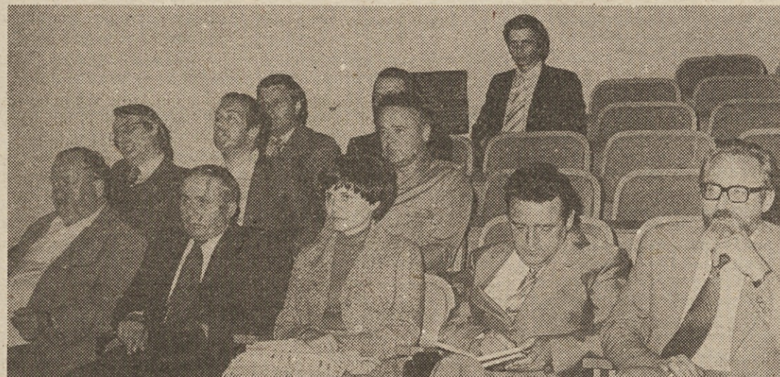
Slovenski pisatelji in pesniki, katerih dela so prebrali delavci Gorenja med prvo bralno akcijo v tem več kot 7000-članskem delovnem kolektivu