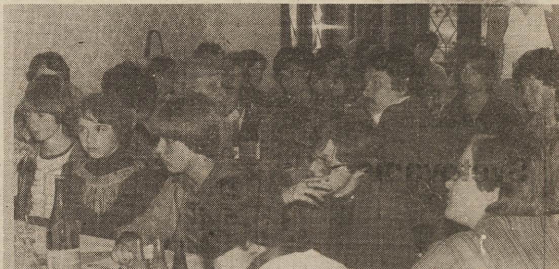
Med delavce Gorenja, ki so se jim pridružili tudi dijaki velenjskih šol, so prišli slovenski pisatelji in pesniki, pripovedovali o svojem delu ter odgovarjali na številna vprašanja ljubiteljev knjige