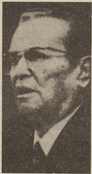
nju sreče,« piše list »Indonesian Observer».