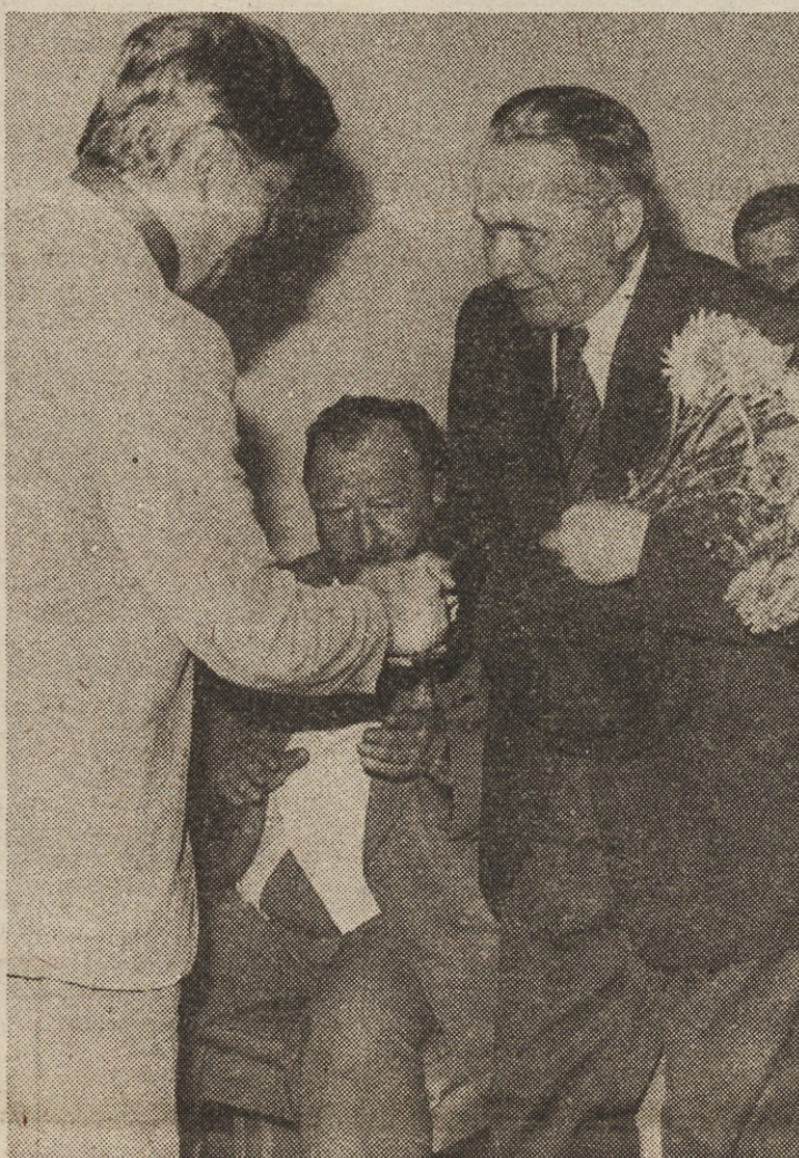
Prvo priznanje »Delavec pisatelju nagrado zvestobe« si je z romanom »Strici so mi povedali« prislužil Miško Kranjec