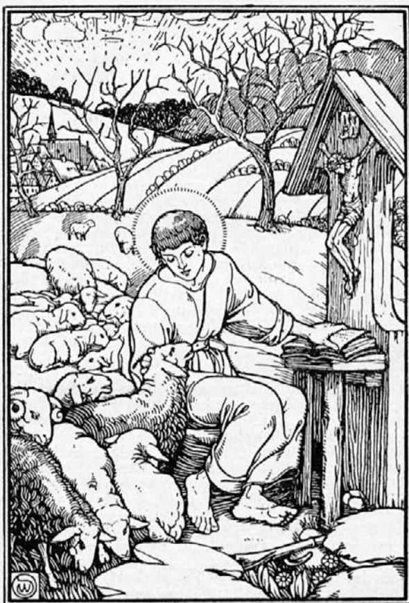
Sveti Vendelin pase ovčice.

smete misliti, da je to kaka nesreča. Nasprotno: vse te stvari niso prav nič potrebne za srečno življenje in srečno smrt. Premnogi svetniki, ki so bili otroci bogatih staršev so iz ljubezni do Boga vse zapustili in postali ubogi.