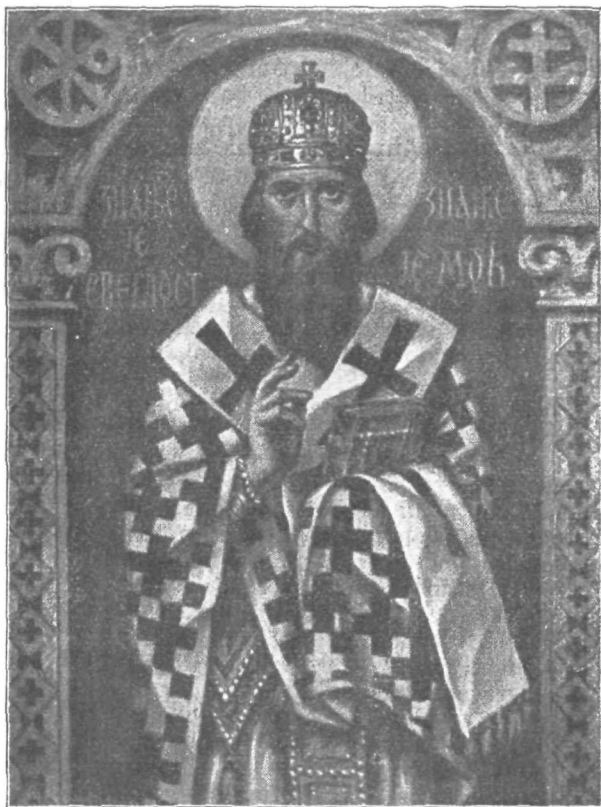
Srbski prosvetitelj sveti Sava (k njegovemu prazniku dne 27. januarja)

V neki pariški tvornici za letala so izdelovali vodno letalo z 1600 konjskimi silami, ki bo letelo s hitrostjo nad 500 km na uro in bo najhitrejše letalo te vrste na svetu.