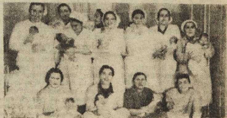
Prvi otroci, rojeni na „Svobodnem tržaškem ozemlju“

Če bodo zahodne velesile to spoznale, če bodo opustile svojo dosedanje politiko, ki ni dajala nobene podpore demokratičnim silam na svojih področjih, temveč jih je raje ovirala, potem ni nobenega dvoma, da bo moskovska konferenca uspela. Vsekakor so se razmere v svetu toliko spremenile, da je težko skleniti kaj dokončnega proti miroljubnemu demokratičnemu hotenju ljudstev vsega sveta. Nosilec teh pozitivnih stremitev pa je po vsem svetu delavno ljudstvo, ki se preko svojih organizacij bori za pravičen, demokratičen in trajen mir.