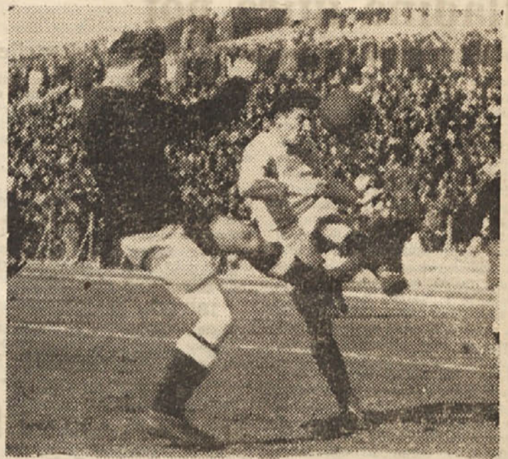
Kljub porazu 1:2 lep uspeh Ponziane

Na Reki je bila v nedeljo odigrana tekma med reprezentancama ZDTV iz cone A in B, ki se je po enakovredni igri končala neodločeno.