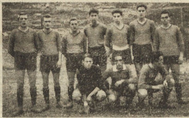
Enajstoričica „Strojnih tovarn“

Letos bo omogočen obisk velikih mednarodnih smučarskih poletov tudi Tržačanom, ki bodo imeli priliko odpotovati v Planico s posebnim belim vlakom. Izlet organizirata Planiško društvo in CAT. Tako bodo Tržačani prvič videli smučarske polete ter uživali na krasnih planiških smučarskih terenih.