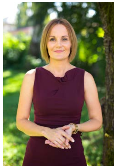
Nuška Gajšek, županja Mestne občine Ptuj