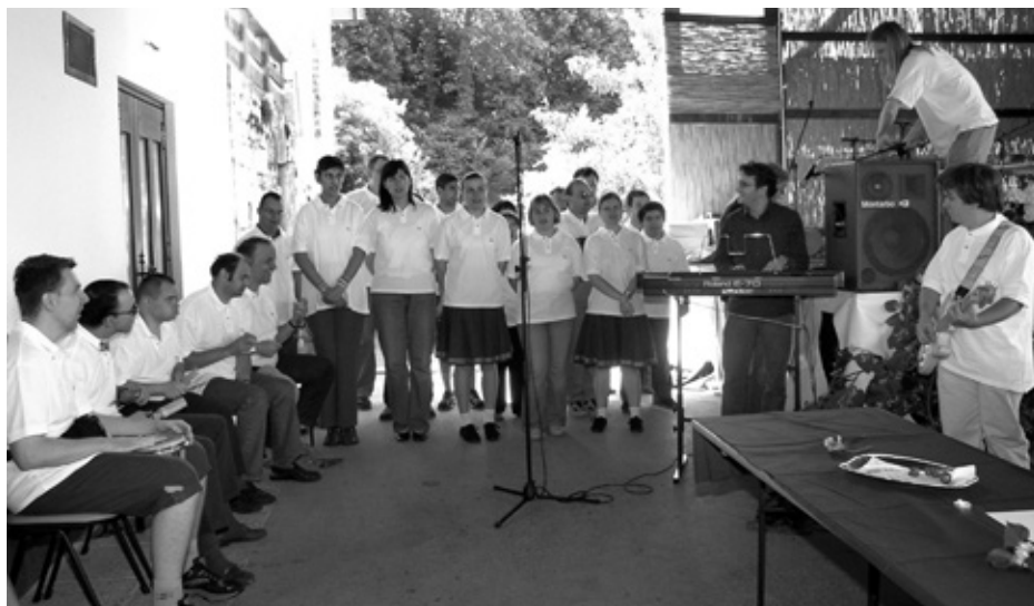
ŽELVE, ki so na zaključni prireditvi Univerze za tretje življenjsko obdobje, peli, plesali in muzicirali.