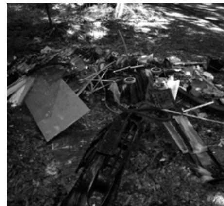
Smeti na Drnovki.