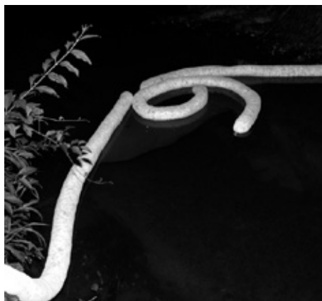
Ujeta nafta v potoku.