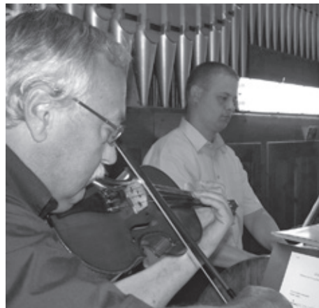
SPODAKJ: »Zdrava Marija« se je občuteno iz orgel in viole razlila po cerkveni ladji.