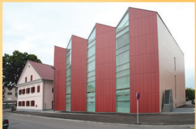
Nagradena zgradba Knjižnice Grosuplje leta 2007.

Knjižnica Grosuplje se aktivno vključuje v oblikovanje kulturnega in družabnega življenja v občinah Grosuplje, Dobropolje in Ivančna Gorica. Ravno v teh dneh se zaključujejo ure pravljic. Zadnja predstava v letošnji sezoni, namenjena najmlajšim, je lutkovna igrlica Kje si kruhek?, kar ni ravno naključje.