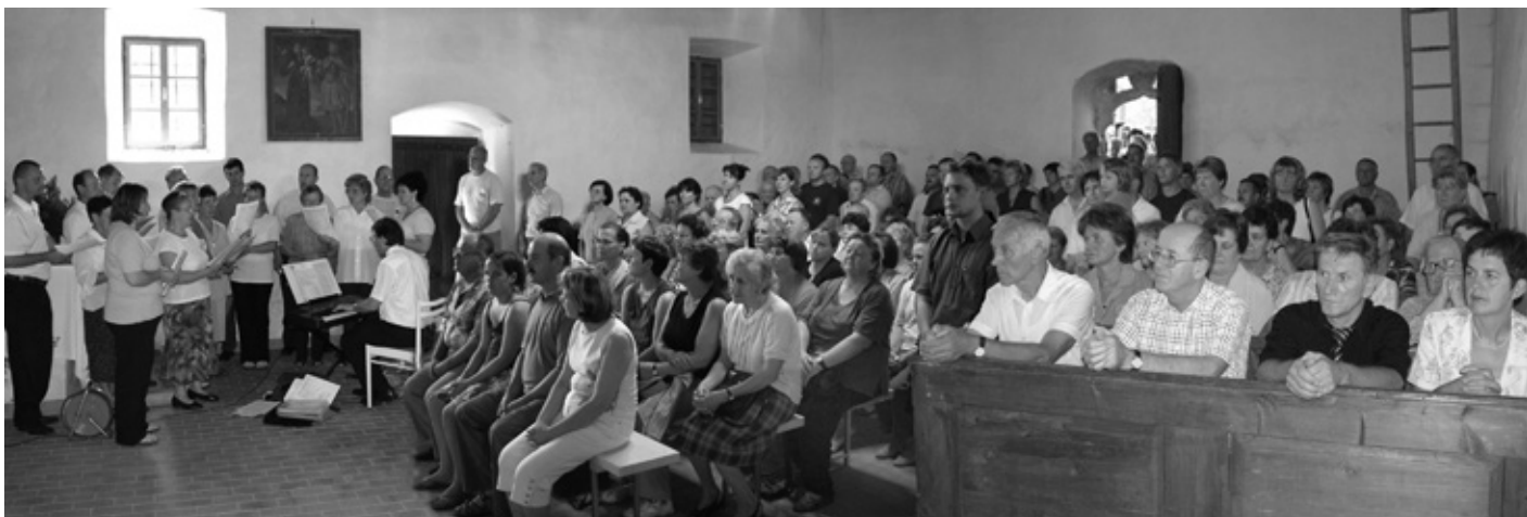
SPODAJ: V cerkvi sv. Duha na Polževem in pred njo se je zbralo veliko vernikov pri maši za domovino.