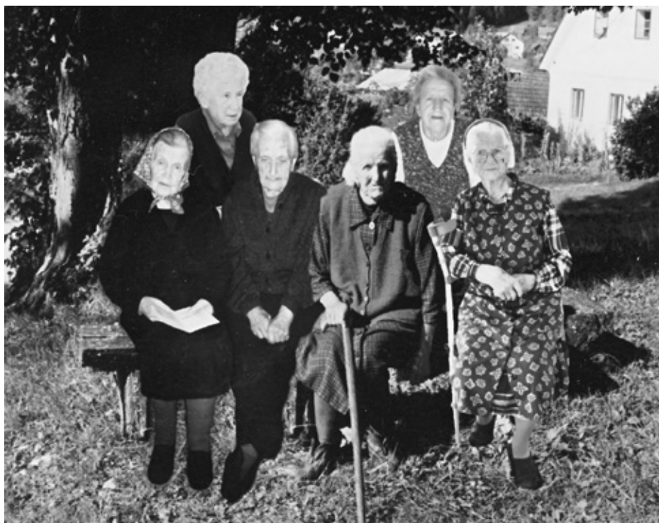
Naših šest jubilatnk pod vaško lipo. Slika je nastala letošnjo pomlad.

Med petimi naselji Krajevne skupnosti Škocjan, ležečinaskrajnem jugozahodnem delu naše občine, je tudi vas Male Lipljene. Selišče je znano po skrivnostnem izvoru imena in drugih bolj ali manj prikritih znamenjih iz večje davnine. V današnjem času pa vzbuja pozornost dolgoživost najstarejše populacije prebivalk. Naselje