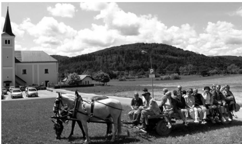
Takole, na vozu, so si udeleženci prireditve lahko ogledali znamenitosti Radenskega polja.