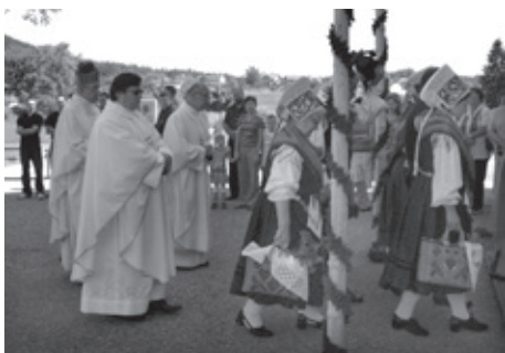
ZGORAJ: Slovesnosti so se udeležili tudi oblečeni v narodne noše.