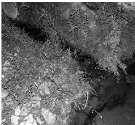
Nafta teče v Grosupeljščico!

Potok Grosupeljščica je bil tokrat zelo nizek, z zelo malim tokom vode, zato mu vsaka »strupena« kapljica škodi in s tem seveda vsej verigi narave, ki jo ta voda namaka. Vsako opozarjanje je le dobronamerno, zato bi rad ta zapis namenil tudi »TISTEMU« in seveda njemu podobnim, ki je te dni (konec junija) na lepem prostoru na Drnovki (hrb nad Jerovo vasjo, nad vojašnico, ki ima sicer tudi lepe trim in sprehajalne steze) odložil celo prikolico domačih smeti, od plastičnih odbijačev hyundaja, otroških vozičkov...itd. FUJ!