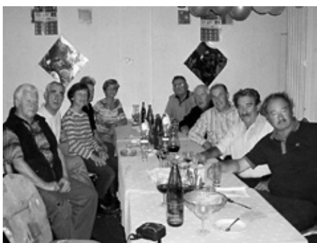
ZGORAJ: Na športnih igrah ljubljanske pokrajine smo osvojili 4. mesto.