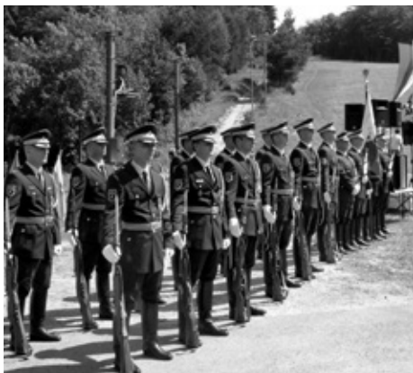
Častna četa Slovenske vojske je bila postrojena v čast domovini na Polževem.