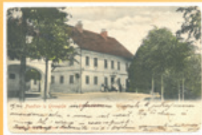
Pisalo se je leto 1904.

za preživetje, tako je tudi pisana beseda potrebna za kakovostno in uspešno življenje ter razvoj,« nam za konec še pove gospa Roža.