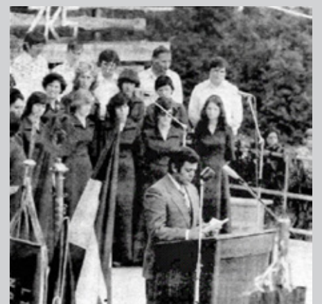
Sekretar republiške konference SZDL Slovenije Milan Kučan: „Preteklost je tista, ki je trdni začetek tega, kar danes ustvarjamo.“