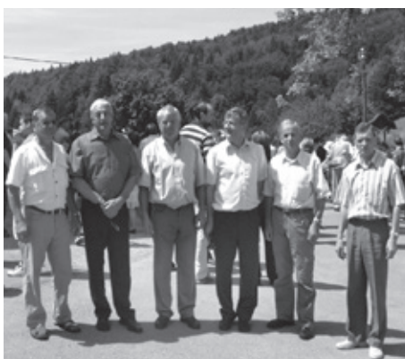
Po maši so iz zvonika v družbo pred cerkvijo v Škocjanu prišli tudi pritrkovalci.

Pri tem pa moramo posebej omeniti njegovo