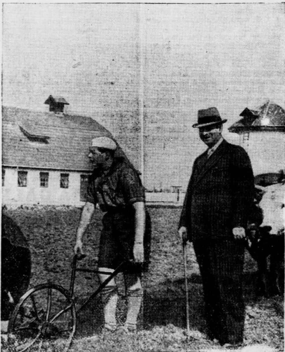
Rumunski prestolonaslednik Mihael orje zemljo na kmetiji v Baneasu poleg Bukarešte v navzočnosti in pod nadzorstvom svojega očeta, kralja Carola