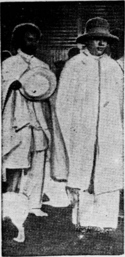
Neguš Haile Selassie in cesarica Menen ob prihodu v prestolnico Palestine. Cesarska gosta, ki ju je vojna pregnala iz domovine, sta se nastanila začasno v hotelu »King David«