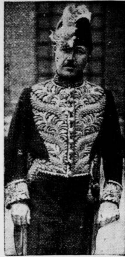
Nemški kancelar Hitler se je vrnil iz Monakovega v Berlin in bo baje še ta teden sprejel angleškega poslanika Erica Phippsa, da mu odgovori na vprašalno polo britanske vlade