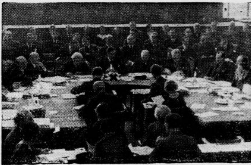
pod predsedstvom angleškega zunanjega ministra Edena (s križcem), kateri je kot zadnji prisostvovala tudi italijanska delegacija z baronom Aloisijem. Na Edenovi desni strani sedijo: Paul-Boncour in Aloisi, na levi pa Avenol in Litvinov