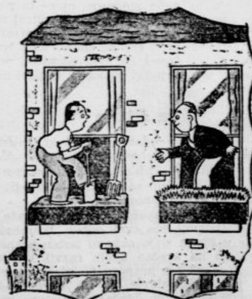
»Prosim, ali mi morete malo posoditi vaše gnojne vile?« (»Everybody's weekly«)