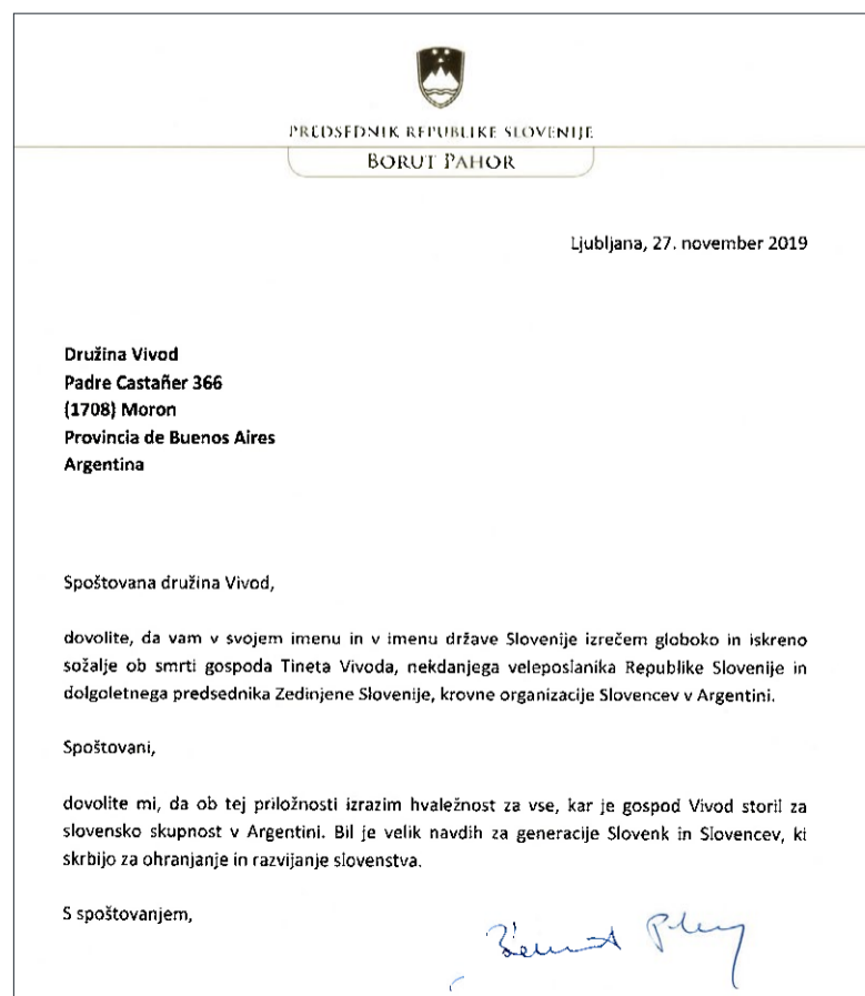
Sožalno pismo predsednika Pahorja

NOVA SLOVENIJA KRŠČANSKI DEMOKRATI Območje Argentina in Južna Amerika