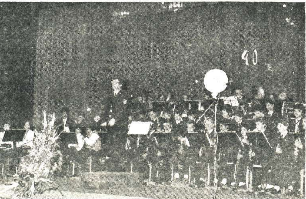
Pihalni orkester DKD Solidarnost Kamnik je imel jubilejni koncert 23. decembra '88 v dvorani kina DOM v Kamniku

posameznih utrinkov z devetdesetletne poti kamniške godbe: ostajajo fragmentarni in gotovo v mnogočem nepopolni. Za temeljito in strokovno raziskavo bo nedvomno potrebnih še veliko