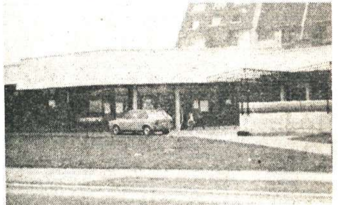
Lastnik avtomobila je odšel po nakupih v trgovino Mercator na Duplici, svojega jeklenega konjička pa parkiraj, kjer se mu je pač zljubilo. Mislim, da so zelenice za okras, poti pa za pešce in ne za avtomobile. Bo kmalu pajek tudi v Kamniku?

Knjiga je moja prijateljica in zato bi lahko bila tudi vaša. Rado Petrovič, 5. č. novinarski krožek OŠ Frana Albrehta