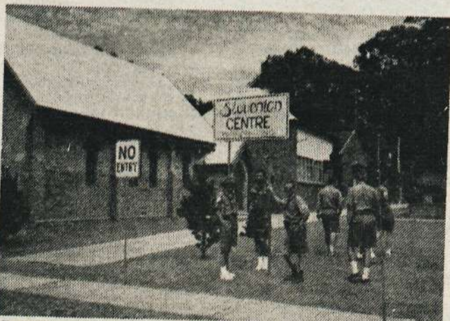
Pred slovenskim domom Triglav v Sydneyu...

Povabili smo ga, naj nam opiše, kaj vse se je dogajalo na skavtskem zletu. »Za začetek bom pojasnil nekaj splošnih stvari, ki se vsakemu skavtu ali taborniku zde same po sebi umevne, bralci pa zanje gotovo ne vedo. Jugoslavija ni v skavtski organizaciji, vendar smo od avstralskih prirediteljev prejeli povabilo, naj se kot opazovalci udeležimo šestnajstega svetovne-