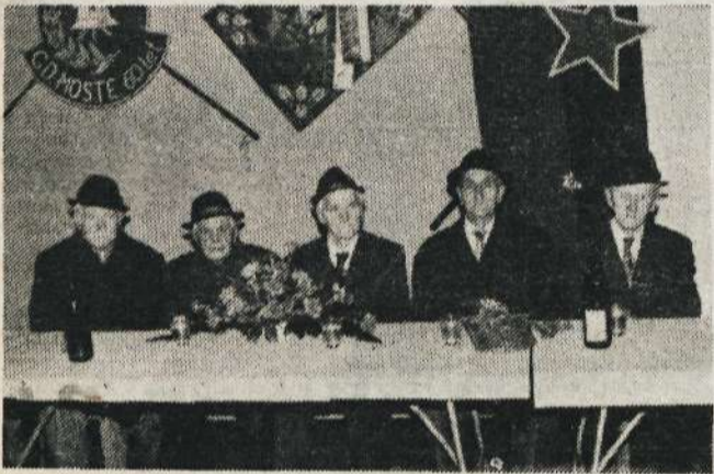
Moščani, ki jim je dano živeti osemdeset in več let; ljudje, ki so v začetku tega stoletja videli, da je treba pomagati sovaščanom v neusmiljeni bitki z ognjem in biti podnevi in ponoči v pripravljeno za humano delo dobili posebna priznanja, v imenu Most in okoliških vasi pa so se jim iz srca zahvalili vsi udeleženci zbora!