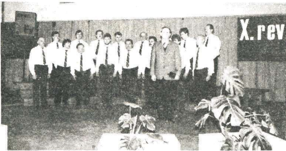
Moški pevski zbor KD Srednja vas sestavljajo v večini kmetje; pojejo v prostem času po napornem delu, pa vendar iz srca zapojo!