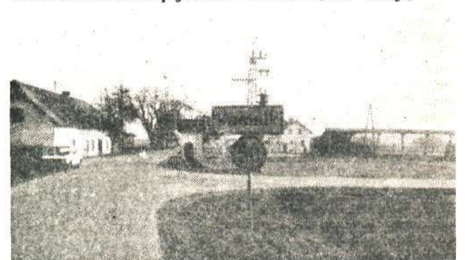
Res bi marsikdo želel, da bi bil Kamnik veliko mesto, vendar tovarši, ki postavljate prometne znake, do Zduše mesto zaenkrat še ne sega! (J. B.)