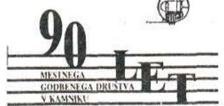
Naslovna stran jubilejne brošure, ki jo je izdal Pihalni orkester ob 90-letnici

SERVIS IN MONTAŽA OLJNIH GORILNIKOV Rajko Avguštin Koželjevo nabrežje 2, Mengeš tel. 737-482 Sprejem naročil od 7. do 8. ure