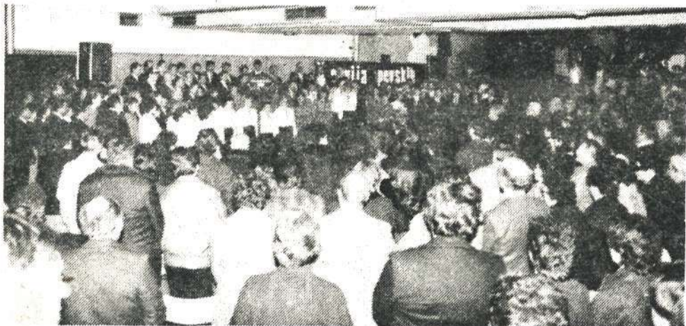
Vsi skupaj smo na koncu zapeli Prešernovo Zdravljico in se navdušeni nad lepim večerom razšli.