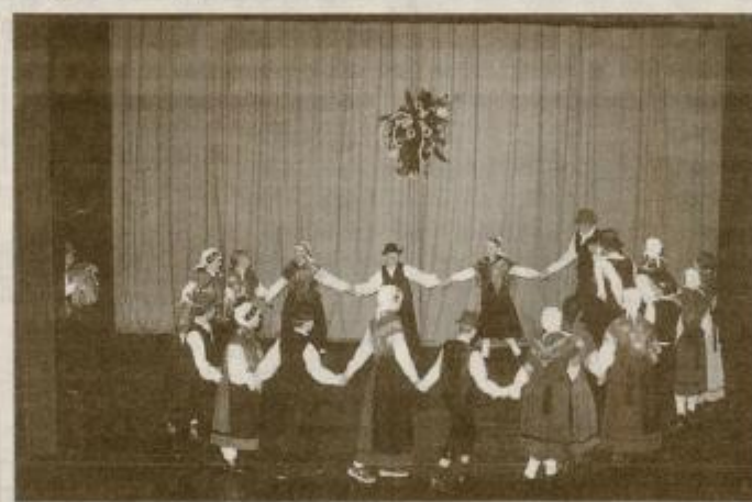
Otroci so zaplesali tudi gorenjske ljudske plesne.

veliko znanja, ki je potrebno za nastanek spleta otroškega folklornega odrskega nastopa, je na koncu dodal Branko Fuchs .