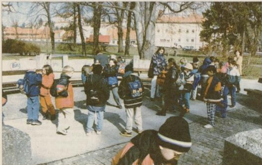
V Mestnem parku v Ptujju je ob lepem vremenu zelo živahno

Z otoplitvijo postaja iz dneva v dan bolj živahno tudi v ptujskem mestnem parku, ki je še vedno priljubljeno sprehajališče mladih in starejših Ptujčanov. V njem so zacvetele že prve cvetlice, na novo so posadili tudi nekaj iglavcev.