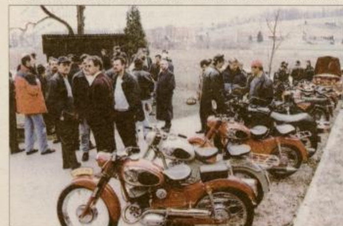
Stari, a vredni občudovanja.