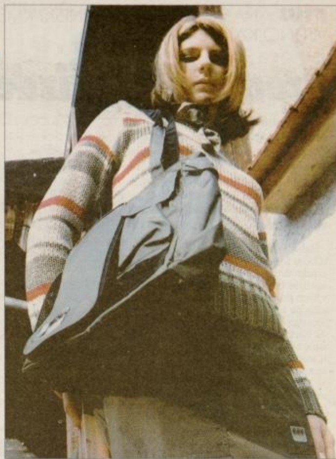
Meli v mladostnem športnem kompletu iz trgovine s.Oliver v centru Domino v Trstenjakovi ulici v Ptuj.

V studiju Olimpic si je Meli izbrala program Olimpic za mlada dekleta. Gre za program, ki je posebej prilagojen za oblikovanje zelene postave in vključuje tudi