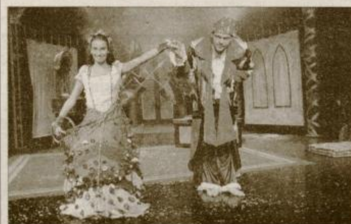
... in ANA IN KRALJ

Pojasnilo: Dvorana v Kranju ima 253 enakovrednih kvalitativnih sedežev, ptujska 133. Zaposlenih imajo 7 igralcev, na Ptuj ni zaposlenega nobenega igralca. Vir: Poslovno in finančno poročilo PG Kranj in Gledališča Ptuj za leto 1999.