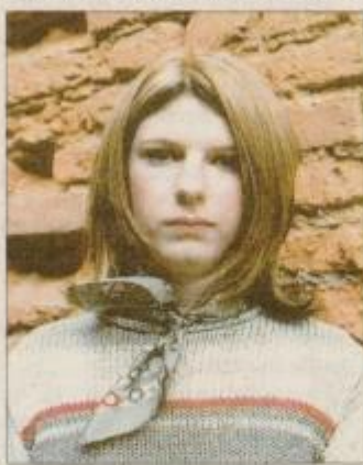
... Meli pozneje

Meli odločil za nežen make up, ki pristoi njenim letom. Na obraz ji je najprej nanasel tanko plast tekočega pudra in ga nato utrdil s pudrom v prahu. Zgornji del vek je osenčil v nežno zelenem tonu, kotičke oces pa v spodnjem delu osenčil v nežno rjavi barvi, notranji del je obrobil z belo barvico, da je odpril pogled. S črno maskaro je obarval le zgornji del trepalnic. Večjo svežino obraza je dobil z obarvanjem ličnic v roza barvi, na ustnice ji je nanesel le zelo svetleč lip glos.