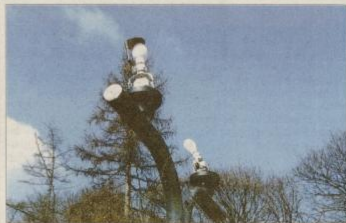
Živahno pa je tudi vsak konec tedna, ko padajo luči ...

Od jeseni 1999 do pomladi 2000 so neodgovorna ravnanja sprehajalcev ptujskega mestnega parka povzročili za okoli 600 tisoč tolarjev škode. Veliko škode pa je tudi na trmski stezi v Ljudskem vrtu.