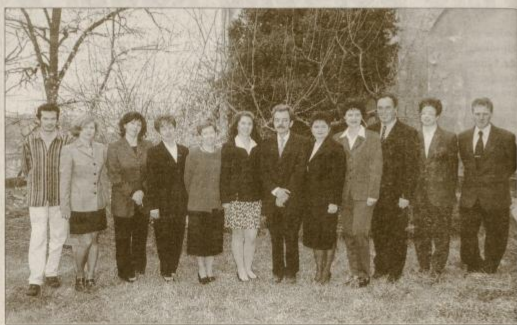
Kolektiv Zgodovinskega arhiva.