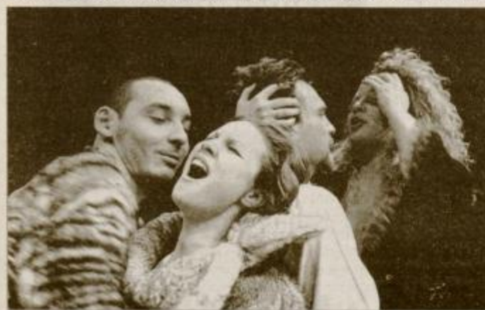
Uspešni predstavi TRIKO...