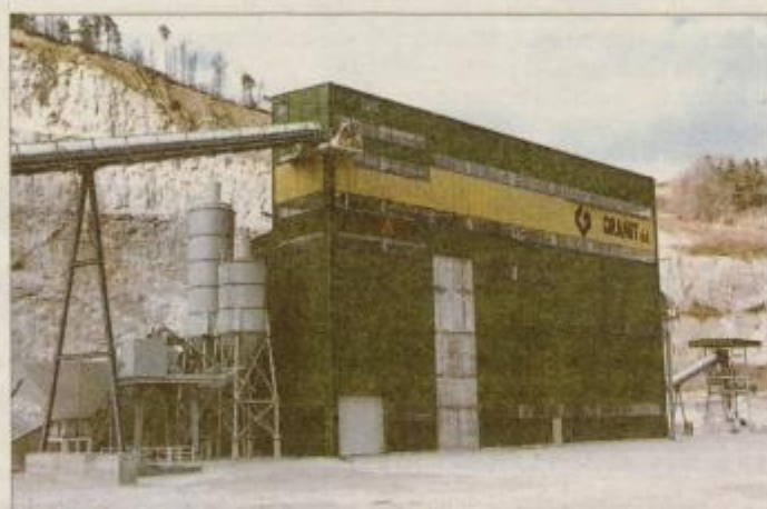
Sodoben objekt nove drobilnice in klasirnice v kamnolomu Poljčane

opremljenost. Med velike lastne naložbe, ki so zaznamovale obdobje zadnjih treh let, prav gotovo sodi postavitve nove betonarne in opreme za transport ter recikliranje svežega betona v Slovenski Bistrici in postavitve nove drobilnice ter klasirnice kamnitih agregatov v kamnolomu Poljčane.