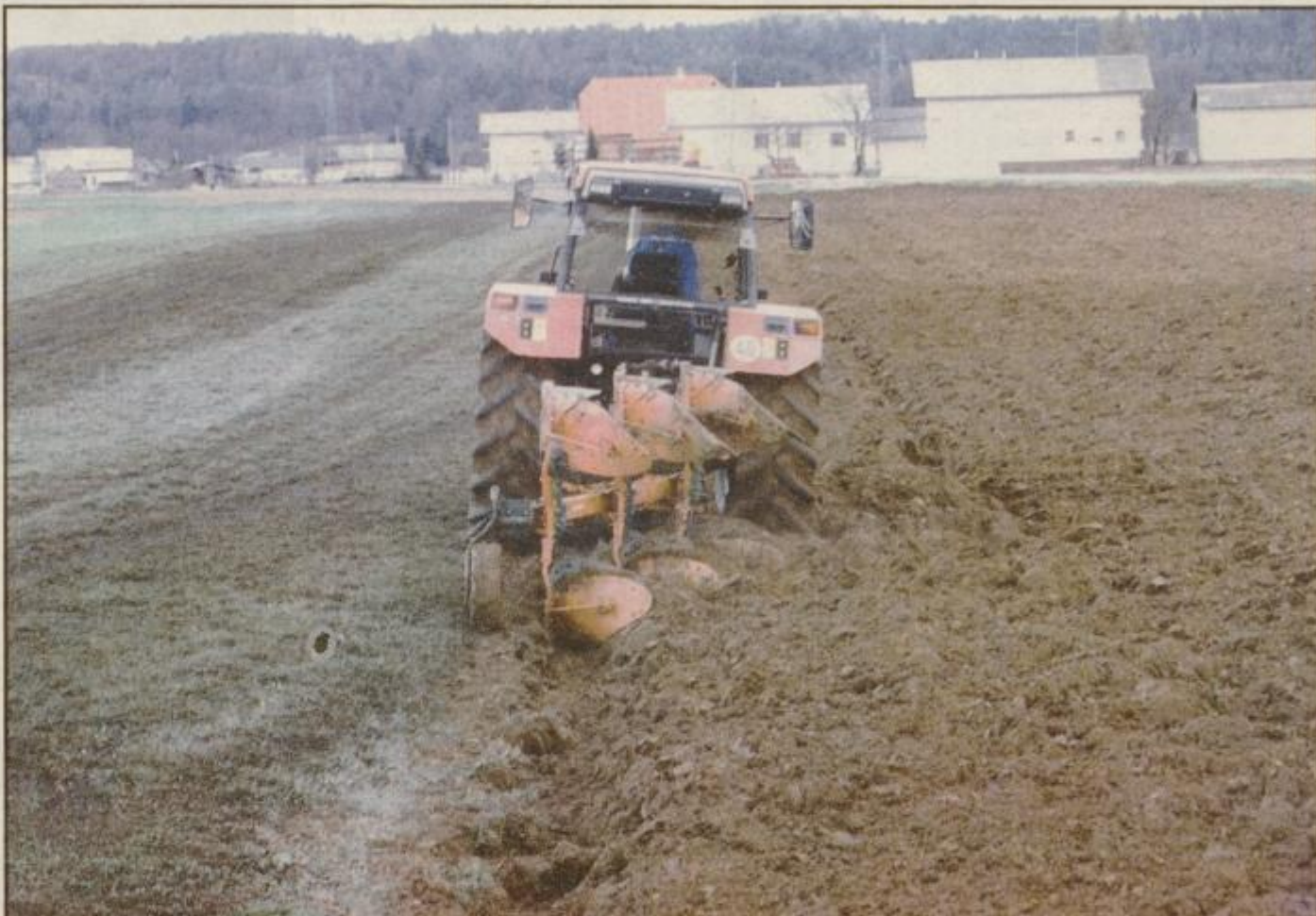
Spomladansko delo kliče.