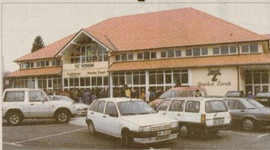
Lep in sodoben poslovni objekt sredi Vidma pri Ptujju z banko, živilsko prodajalno, cvetličarno in gostinskim prostorom