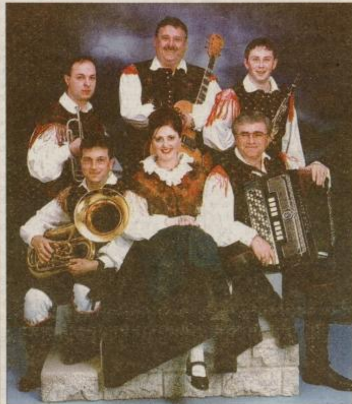
Ansambel Zvoneta Šeruge.

Material za novo kaseto - radi bo jo izdali vsaj do konca leta - že nastaja, dosedanje pevsko troglasje smo dopolnili. Ostali smo pri značilni slovenski - gorenjski narodni noši, najraje pa tako kot zmeraj igramo narodne sklade, s katerimi smo starejši člani ansambla »gor rasli«.