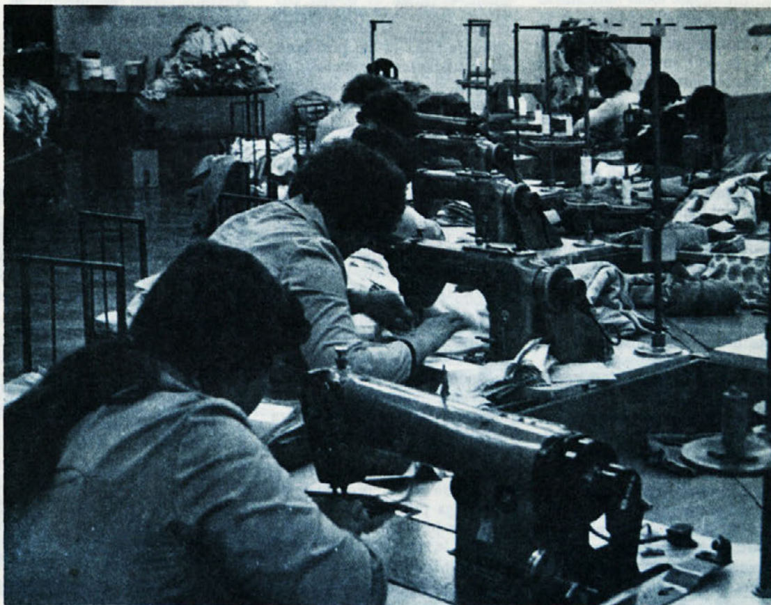
V občini Krško poteka na pobudo Skupnosti zdravstvenega varstva akcija za socialno pomoč. Tudi IO OOS TOZD LIBNA je pristopil k akciji in že pripravljajo predloge (glej stran 6).

nosti materialne proizvodnje za obdobje 81 — 85 pa še do danes ne moremo trditi, da so usklajene s hotenji in z zmoglostmi združenega dela. Tako bodo morale SIS materialne proizvodnje še v prvem tromesečju prihodnjega leta sprejeti anekse k samoupravnim sporazumom, s katerimi bodo natančneje opredelili osnove in merila za združevanje sredstev. Sedanji predlog prispevnih stopenj lahko zatorej smatramo le kot globalne obveze, ki jih bo potrebno s kasnejšimi aneksi dopolniti. Iz doslej razpoložljivih podatkov nam izračuni kažejo, da bodo obremenitve v letu 1981 večje za cca 6 do 8 odstotkov (izračun je približen). Po predlogih samoupravnih sporazumov občinskih gospodarskih in družbenih SIS imamo podobne težave tudi v posameznih občinah. Do dne 4. decembra, ko smo pripravljali ta prispevek, smo razpolagali s podatki le za občino Novo mesto, Ptuj in Ljubljana — Bežigrad.