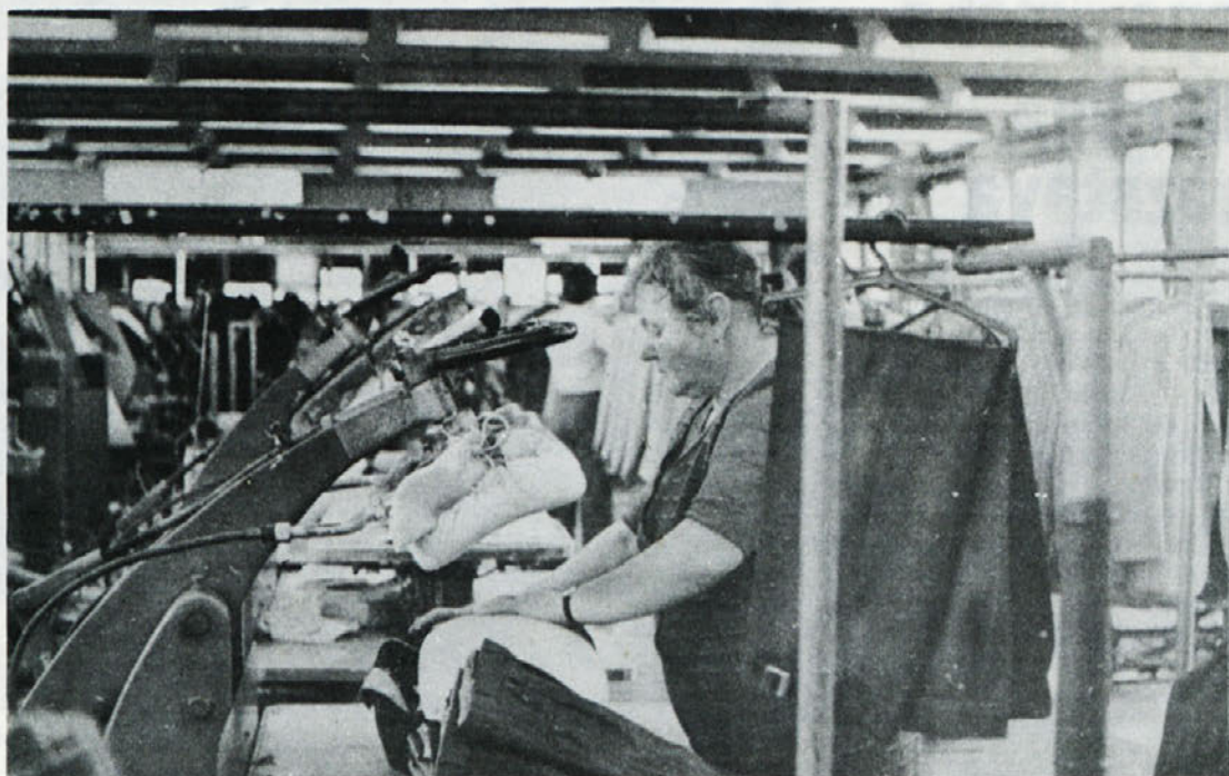
Kljub zimi je v likalnici vroče. Posnetek je iz TOZD TEMENICA.