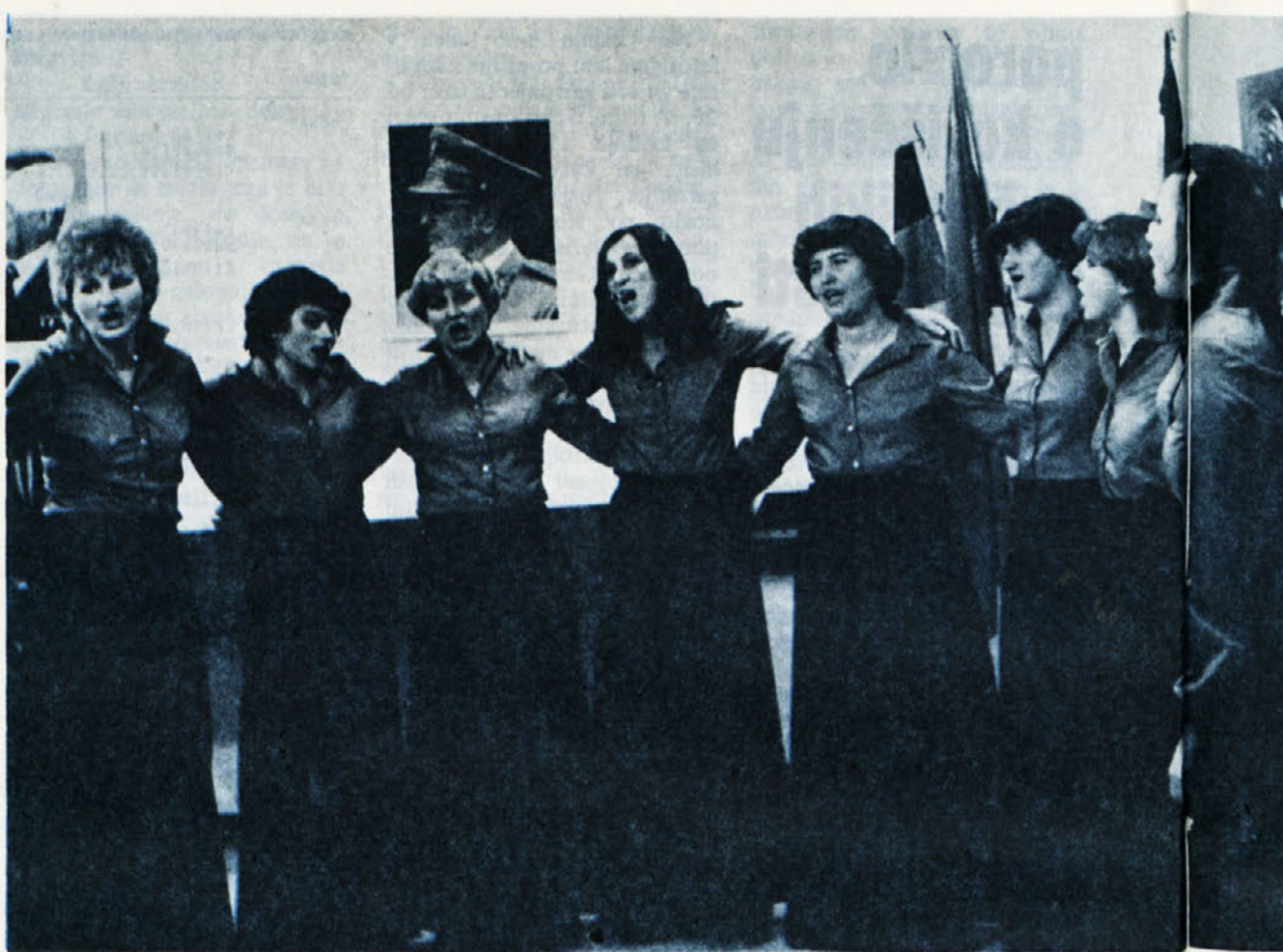
Ob otvoritvi razstave fotografij tovariša TITA so nam v kulturnem programu zapele tudi delavke TOZD LIBNA.

V času vstaje in ustanavljanja enot narodno osvobodilne vojske (NOV) so bile razmere v naši deželi zelo težke. Z golokrikih partizanskih odredov, brez tovarn orožja in municije oziroma streliva, brez skladišč in raznih vojnih rezerv živil, brez pomoči, je zrasla armada s približno četrtilijonimi borci,