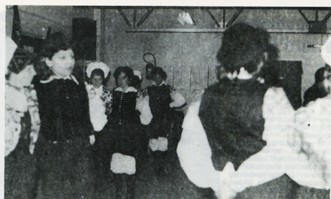
Mladinci TOZD DELTA so ponovno dopolnili svojo folklorno skupino in tako dekleta in nekaj fantov že pridno vadijo za nastope.