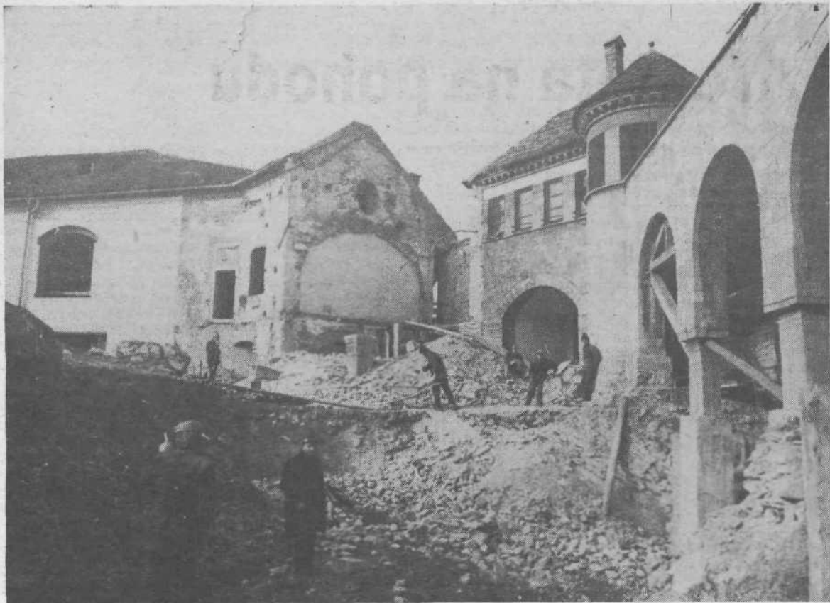
Grajsko poslopje iz dneva v dan odkriva nove površine, zidovje pa je vse trdnjše