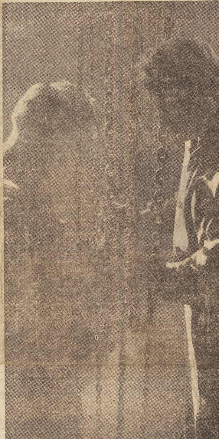
NA ZACETKU LINIJE »NOTRANJI TRANSPORT«