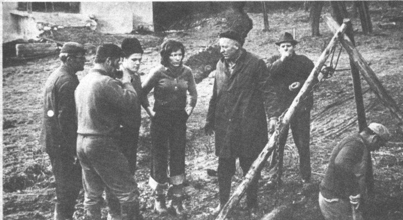
Kljub temu, da je bilo zelo mrzlo, se je prilegel kozarček rdečega. Cesto v Bevče so namreč krajanji v času udarniškega dela zaprli in vsakdo, kci je hotel v vas, je moral dati za liter rdečega. Še sreča, da se tistega dne ni pripeljalo veliko ljudi v Bevče.

Ko sem se vračal iz Bevč, mi je še dolgo zvenel v ušesih stavek, ki sem ga mimogrede „ujel“: Kdaj še pridejo nekateri iz mesta na deželo? . . . Ko je treba kakšen star štedilnik v stran vreči . . .