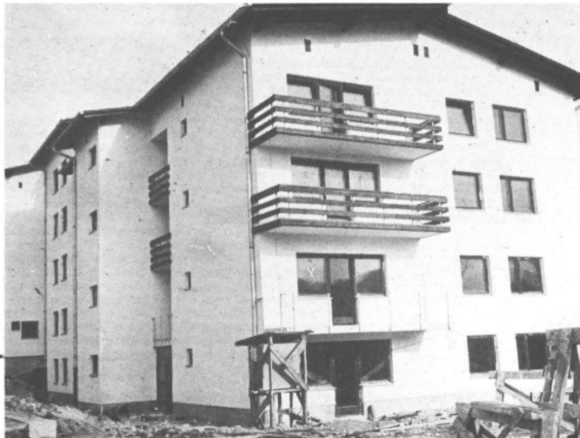
Potrebno je: opraviti le še obrtniška dela in urediti okolico in dom bo lahko sprejel prve stanovalce

darstvo Ivan Kolar. Ta bo obrazložil še predlog odloka o tem za katere objekte v prostoru in pomožne objekte je še potrebno lokacijsko dovoljenje in urbanistična rešitev, odlok o javnem redu in miru ter komunalni ureditvi ter predlog odloka o urejanju, vzdrževanju in varstvu zelenih površin v občini Velenje. Delegati bodo obravnavali tudi predlog odloka o potrditvi rezervata za gradnjo magistralnega plinovoda SR Slovenije na območju občine Velenje, predlog o poimenovanju ulic in cest v naselju Konovo, Šalek, Gorica ter predlog sklepa o zaposlitvi več kot 5 delavcev v obrtnih delavnicah.