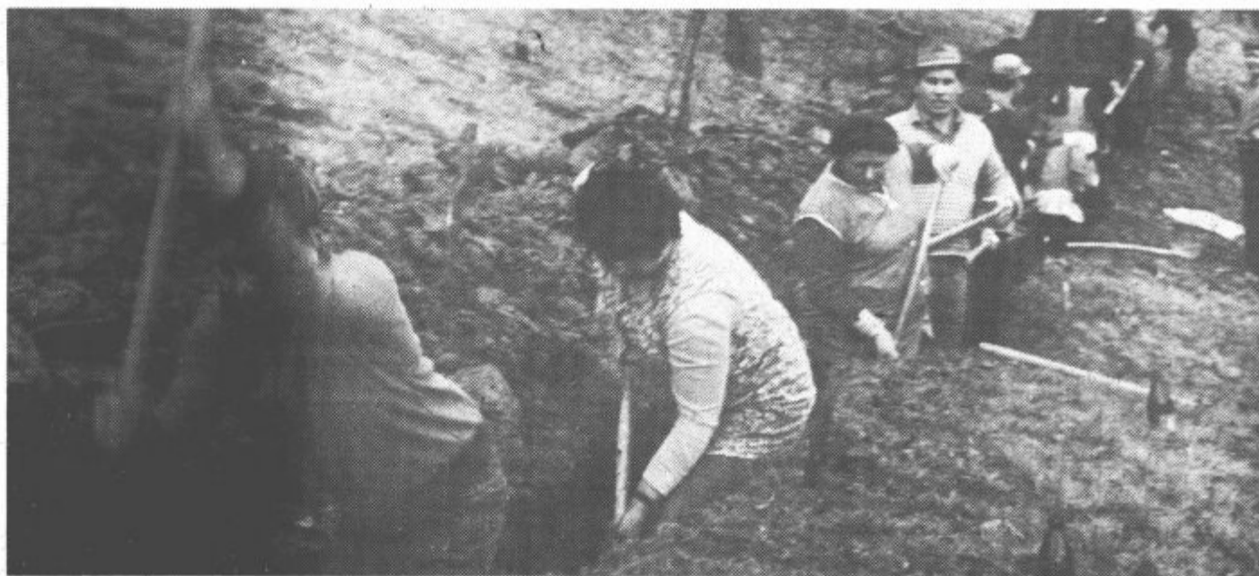
Sobotne akcije so se udeležili vsi: mladi, stari, ženske in otroci.

Naša krajevna skupnost je zelo majhna, domačije pa raztresene po dolgem in počez. Prav zato v preteklosti nismo mogli brez finančne pomoči opraviti tega za nas življenje pomembnega vprašanja. Toda čas je mineval spreminjala se je podoba naše vasi in izoblikovala se je visoka zavest naših vaščanov do skupnih potreb. Rezultat tega je bil lanski referendum, za katerega smo vsi glasovali. Takrat smo si dejali, da je že skrajni čas, da v vse naše domove priteče čista in zdravju neškodljiva pitna voda. Ko smo napravili predračun, smo ugotovili, da potrebujemo kar 117 starih milijonov dinarjev. Vsakdo bi se ob tako visoki vsoti prav gotovo prijel za glavo. Tudi mi smo se tako na začetku, toda naših želja se nismo hoteli odreči. Prvi sklep je bil, da moramo stroške napeljave vodovoda čimbolj poceniti. Zato smo se odločili, da bomo vsa zemeljska dela