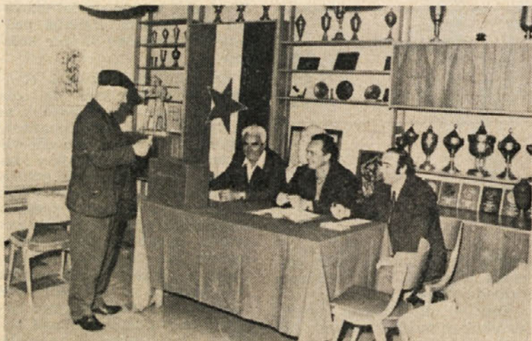
Na drugem mestu je bilo osmo volišče s 84,6 % udeležbo (na sliki), kjer so volili delavci iz vzdrževalnega sektorja