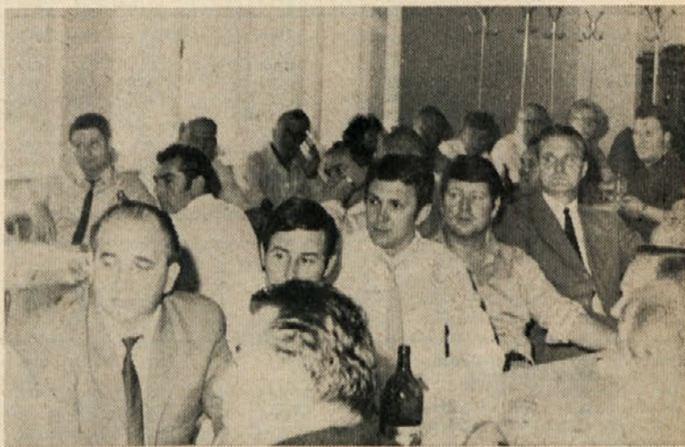
V soboto, dne 13. junija je našo osnovno organizacijo sindikata obiskala delegacija štajerskih sindikatov iz Avstrije. Gostje so se zanimali za vlogo in naloge sindikata v delovni organizaciji ter za delovanje samoupravnih organov. Po razgovoru so si predstavniki sindikatov ogledali nekatere naše obrate