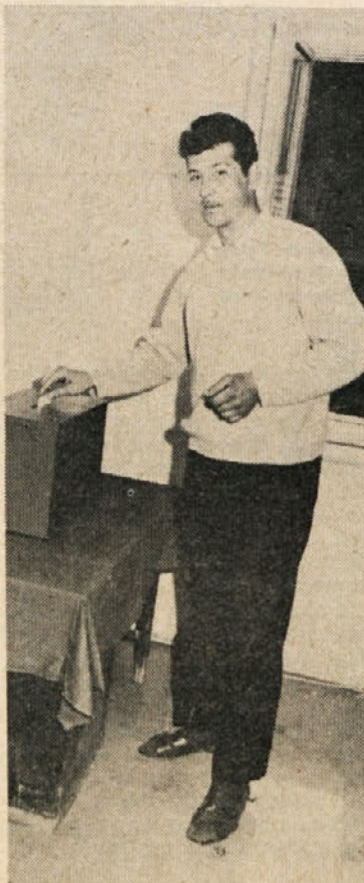
Odločil se je za tiste sodelavce, o katerih je mislil, da bodo najboljše opravili zaupano nalogo v prihodnji mandatni dobi