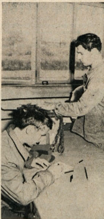
Volišče v novem obratu žveplene kisline