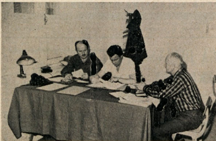
Na volišču v kemiji ugotavljajo, koliko volivcev je že volilo