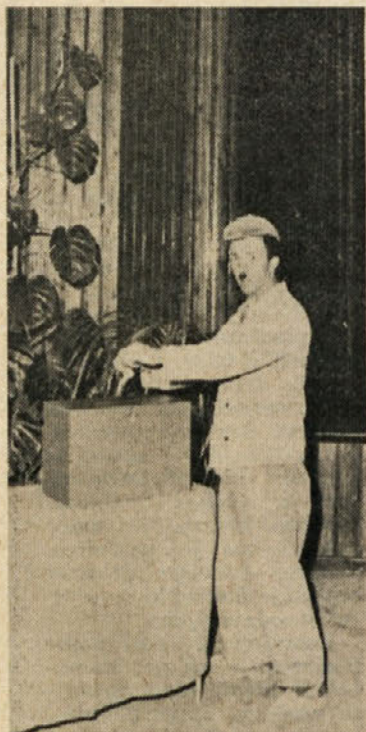
Ko se je odločil za najboljše, je oddal volilni listek v skrinjico