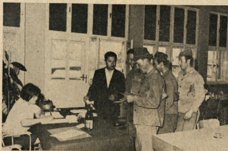
Pogled na volišče v sindikalni dvorani