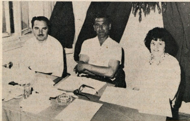
Volilna komisija čaka na poslednje volivce