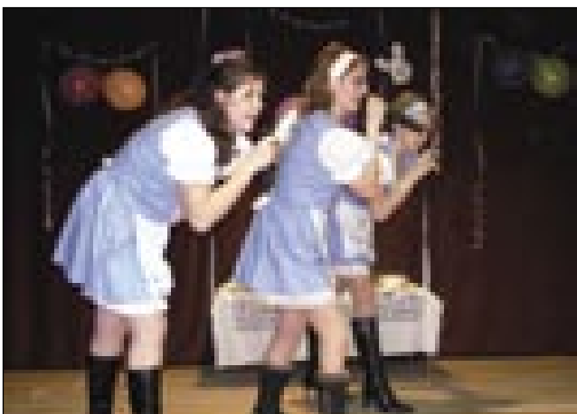
Gornjeseniški Atomik harmonik

Kot vsako leto se je tudi letos začel program s karnevalsko povorko. Na odru v kulturnem domu so se najprej predstavili malčki z otroškega vrtca, sledili so jim osnovnošolci v posameznih maskah, na