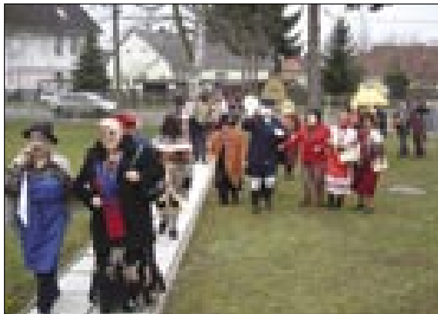
Penzionistom se je nej vnaužalo titi malo okauli Slovenskoga doma