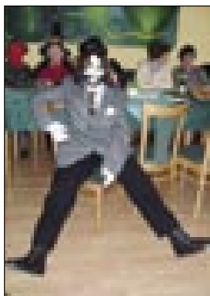
Za lajflinom moškoga se je skrivala ženska

Sveteč se je letos za štiri vekše programe zgoučalo. Tau so: fašenski karneval z balom v februaru, endnevni izlet (ki-