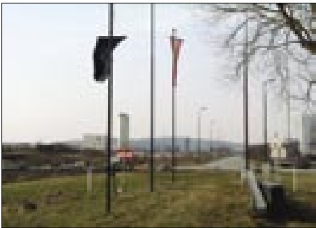
Pri spomeniku prijateljstva na meji visi namesto madžarske črna zastava

lja. Sočasno, ko se zavzema za odstranjanje nevarnih objektov v sosednjih državah, denimo jedrske elektrarne v Krškem v Sloveniji, je pripravljena prepeljati onesnažene odpadke na obrobje svojega ozemlja, v neposredno bližino meje z Madžarsko. Tak primer je zemlja, ki so jo na Dunaju izkopal ob gradnji podzemne železnice in jo prepeljali na južno Gradišćansko. Mnogo hujša in trajno nevarna zadeva je napovedana gradnja sežigalnice odpadkov v industrijskem parku Heiligenkreutz, v neposredni bližini Monoštra, kjer se že kadi iz elektrarne na lesne odpadke in kjer Rabo in Lapincs onesnažuje usnjarna.