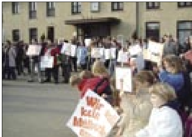
Protesta na železniški postaji v Monoštru se je udeležilo kakih 1500 ljudi

Nadalje prosimo vlado R Avstrije, da naj s svojim zgledom vpliva na dejavnike, ki povzročajo onesnaževanje rek Rabe in Lapincsa.“