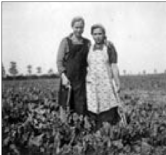
S sestrov na repi v Vassurányi