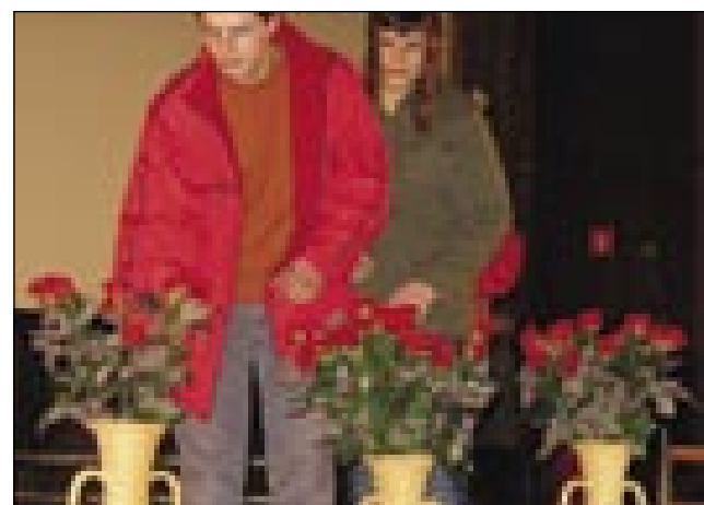
V Soboti je 85 mladi prineslo na oder 85 rauž

dnevnik (napló), ka so pisali cejlo življenje. Na prireditvi je spejvo pevski zbor cerkve (stolnice) sv. Nikolaja tri pesmi. Za tretjo pesem so napisali reči