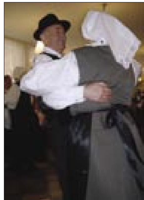
Folklorna skupina drüštva penzionistov iz Ljutomera

brezi toga, ka bi se lidgé nota opravili, skrili za kašne maske. Penzionisti so se dobro znajšli, meli so indašnje pa na nauvo vözmislene, zanimive, aktualne figure, kak stara püklava babica, ciganjica, vrag, bohoc, elegantna stara gospa, prometnik (forgalmista), velka familija, stera se je z velikimi pöjnkli prejk-skvatejrjala na Švedsko, deklina... Med vsejmi je ena moška maska brigala vsakšoga najbola, bila je nejma pa v kašnoj skrivnosti se je nota postavila, v tašnoj skrivnosti je minaula tü. Ka