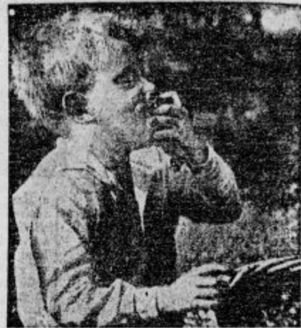
»Hm, kako so dobre!