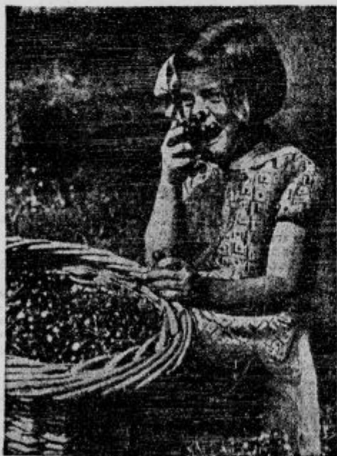
Deklica vživa sladki prvi sad.