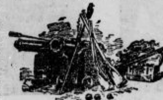
Nisem pozabil na orožje.

»Mlad si še in še na začetku svojega življenja. Jaz pa sem star in že na koncu. Lahko si misliš, da imam že precej izkušenj in da sem se tudi že marsikaj naučil iz izkušenj drugih. Vedi torej, da podjetje, ki se začne