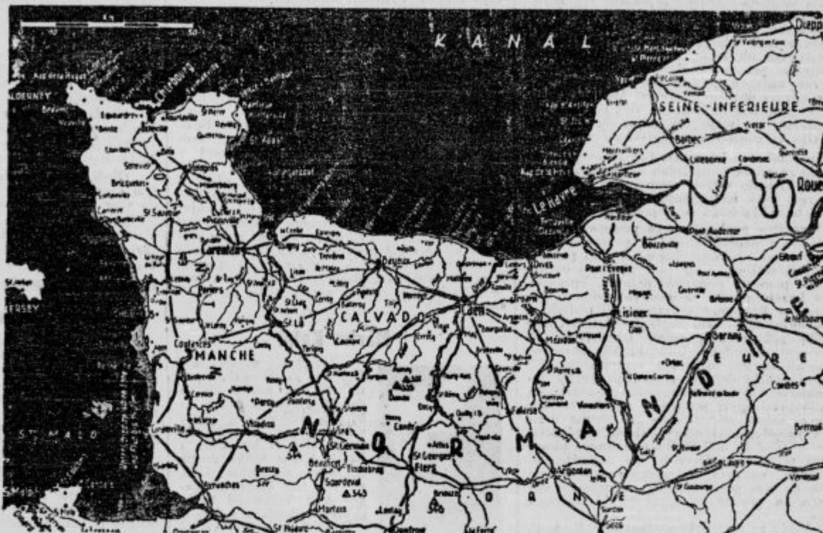
Zemljevid k sedanjim bojem v Normandiji.

Iz Fort du Roula javlja čopisnik »United