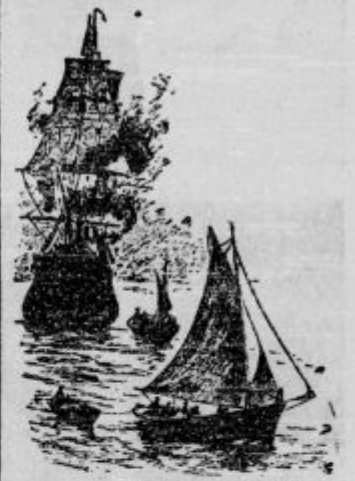
Zagledali smo veliko ladjo v plamenih.

Ker so mornarji slišali topovski strel, ladja ni bila tako zelo daleč. Obrnili smo ladjo v tisto smer in čez kake pol ure smo zagledali veliko ladjo v plamenih.