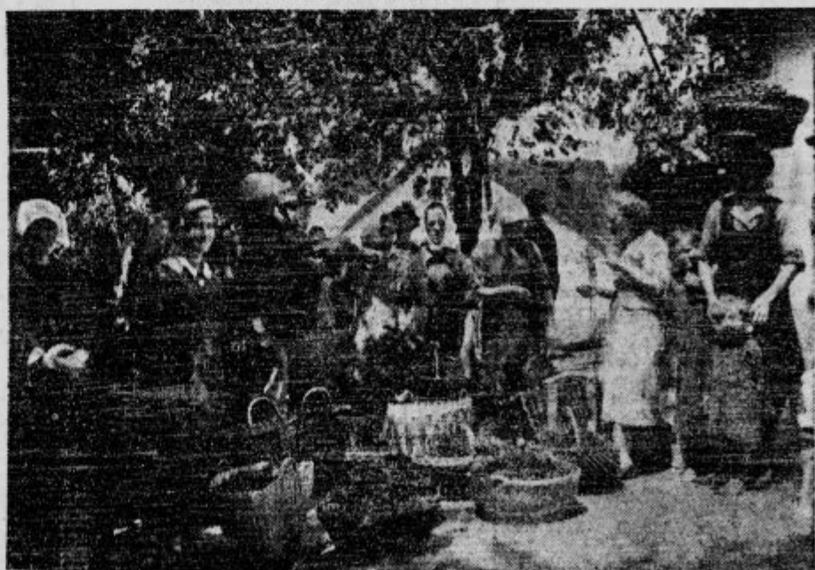
Kupčija s češnjami v Brusnicah na Dolenjskem.