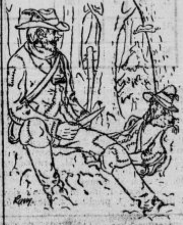
»Ako bi ne bil jaz njega, bi bil pa on mene.«

»Ko mu prinesem tvoje pismo, me pogleda, kakor bi me hotel pogledati v duo duše. Jaz pa sem se tako neumno držal, kakor bi ne znal do pet šteti. Kdo ti je dal to pismo? me vpraša. — Neznani človek ga mi je izročil na poti in mi dal srebrni tolar za to, da sem ga sem prinesel. Ko me še vpraša za moje pisanje, pravi: malo počakaj! in odide čez vežo v drugo sobo. Tisti čas jaz hitro odprem omaro in — smuki je šel lepo višnjevi frak pod moj kovašček. Cilinder je ležal na mizi. Menda je imel samo enega.