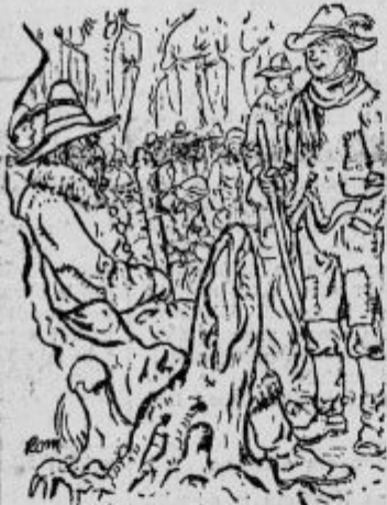
»Brihtnih glav nam manjka...«

»Razumem in naredim, kar si ukazal, harambaša,« odvrne Devs. »Pa sreča z vama!« reče Veliki Grogga in se obrne k drugim.