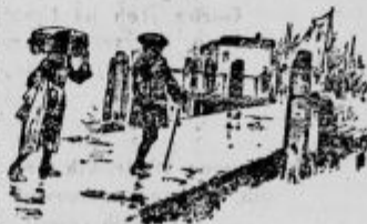
S Petrom sva se vkrcala na ladjo.

čaka, na katero sem dal naložiti poleg že omenjena zloživne ladje še mnogo drugih stvari, ki bodo zelo koristne naselencem na otoku. Ne samo stvari, vzel sem s seboj tudi nekaj delavcev in sicer dva mizarja, kovača in malega brihtnega močička, ki je po poklicu bil sodar, a je poleg tega bil tudi dober mehanik, kolar, čevljar, krojač in ne vem kaj še vse. Pridružil se nam je še nek krojač, ki je sklenil, da gre iskat srečo v Indijo. Mornarji so se mu smejali in ga vpraševali, če gre oblačit divjake po modri Med potjo pa se je premislil in ostal na mojem otoku, kar je bilo za vse zelo koristno, ker se je izkazalo, da ni bil samo sproten v vial, ampak je znal še mnogo drugih koristnih stvari.