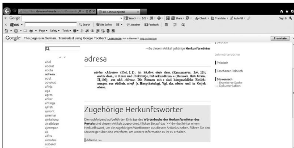
Slika 1: Ponazoritev vmesniške podobe pri iskanju prek seznama iztočnic (na spletu).