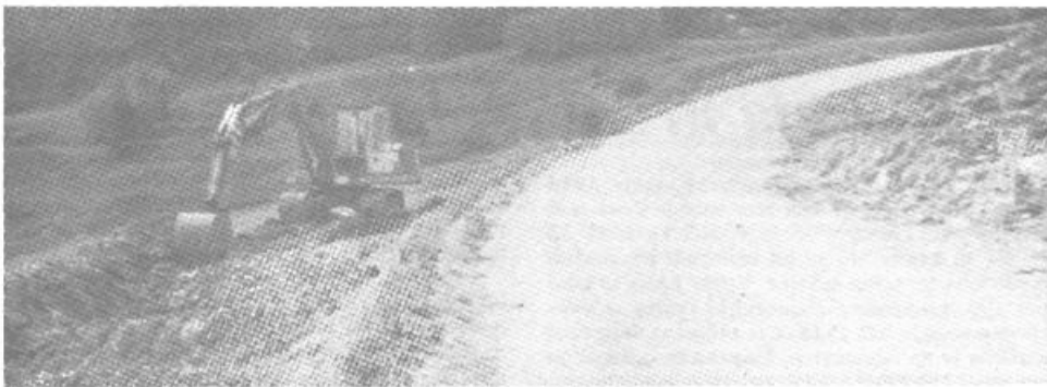
Široka in lepa bo nova, težko pričakovana cesta na Rakitno

30. junija sem se nekaj po 12. uri vračala iz trnovske bolnišnice mimo kina Vič do Tržaške ceste na avtobusno postajo. Ker mi je avtobus, ki odpelje s te postaje ob 12.30 uri, pred tem odpeljal, do prihoda naslednjega pa je bilo treba čakati še skoraj celo uro, sem se odločila – čeprav lokal optika Mira Krstiča na Tržaški cesti 7 zapirajo ob 13. uri – da stopim pogledat kdaj delajo. Lokal pa je bil odprt in do 13. ure je manjkalo še nekaj minut. Po skupini mladih, ki so izbirali okvirje in stekla za sončna očala in še enim gospodom