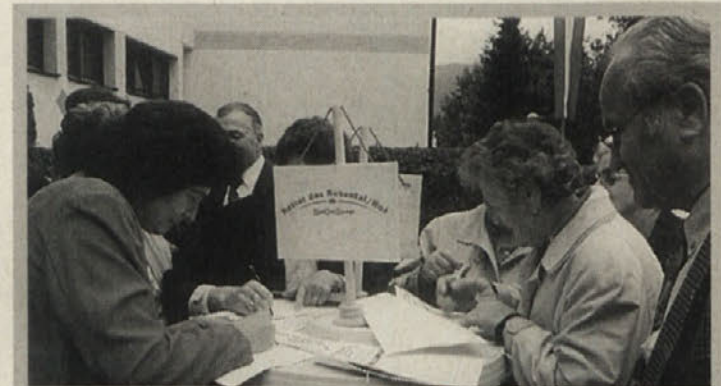
Podpisana akcija proti visokotirni železnici skozi Rož uspešno poteka. Tudi v Kotmarji vasi so ljudje trumoma podpisali protestno resolucijo

Peršak je navzoče novinarje presenetil z informacijo, da Hrvaška v zameno za zaprtje Krškega načrtuje gradnjo dveh novih jedrskih elektrarn. To pa ne bi bil samo dodaten problem za Slovenijo, ampak tudi za Avstrijo. F. W.