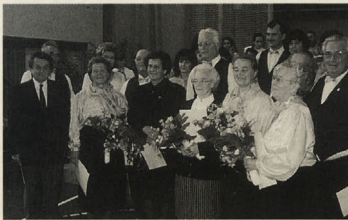
Zaslužni prejemniki zlatih Gallusovih značk SPD »Gorjanci«