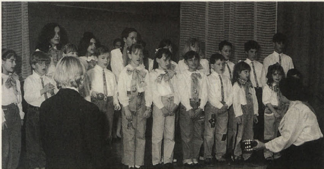
Up za nadaljnje kulturno delovanje: otroški pevski zbor