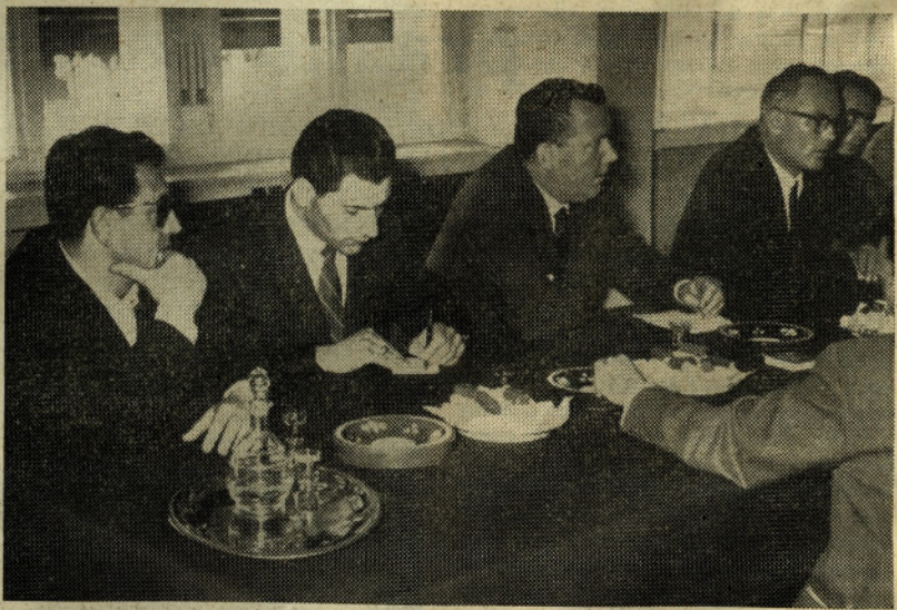
(Nadaljevanje s 1. strani)

lavcev pri sprejemu in med delom, objektivno družbenega standarda in zaščita pri delu.