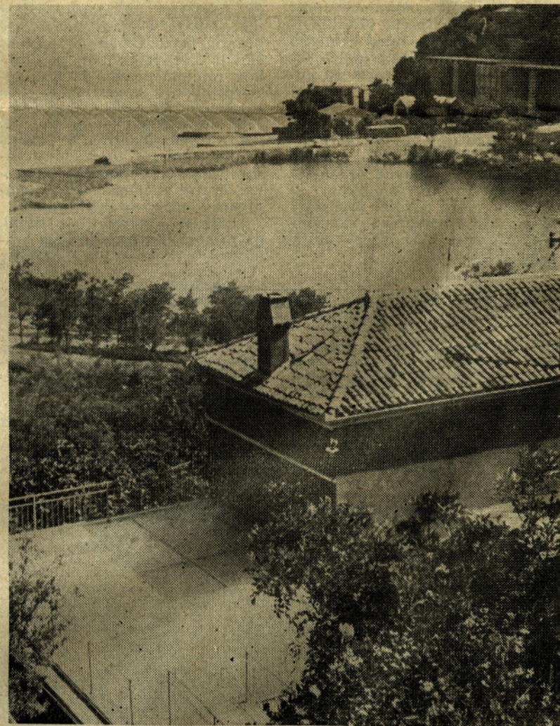
Ob našem počitniškem domu je prostorna in sončna terasa s prijetnim razgledom

Pred tremi leti je doživela Fiesa svojo največjo spremembo. Takrat so zgradili največje objekte, med katerimi je najbolj bahav arhitektonsko zanimiv dom Velenja. Poleg njih imajo