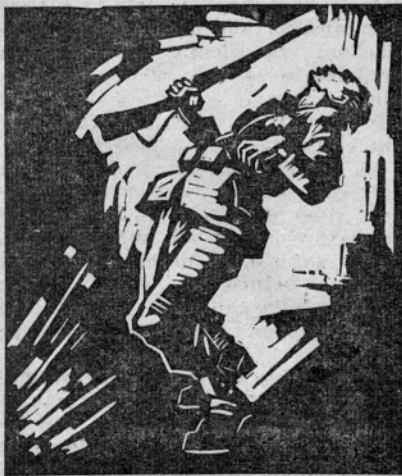
NIKOLAJ PIRNAT: PADEL ZA SVOBODO