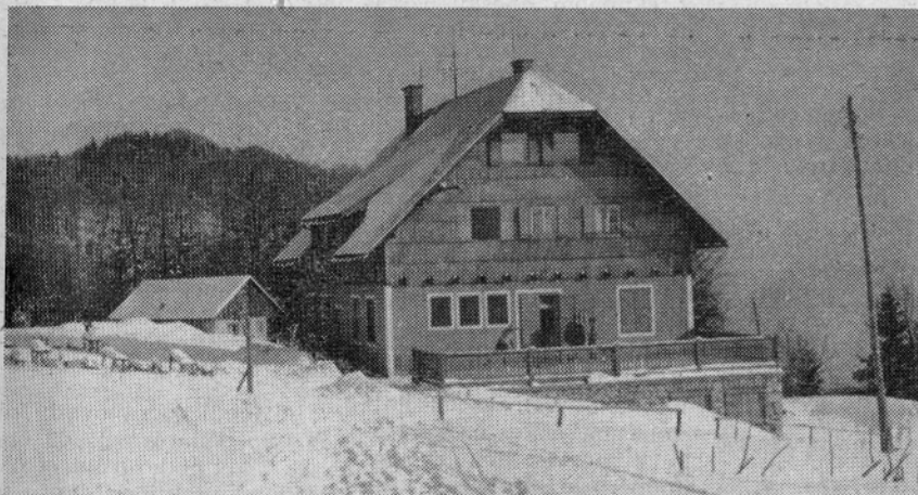
Dom na Šmohorju — prijetna planinska postojanka vas vabi...

Zakon je začel veljati 6. januarja 1968, uporablja pa se od 1. januarja 1968.