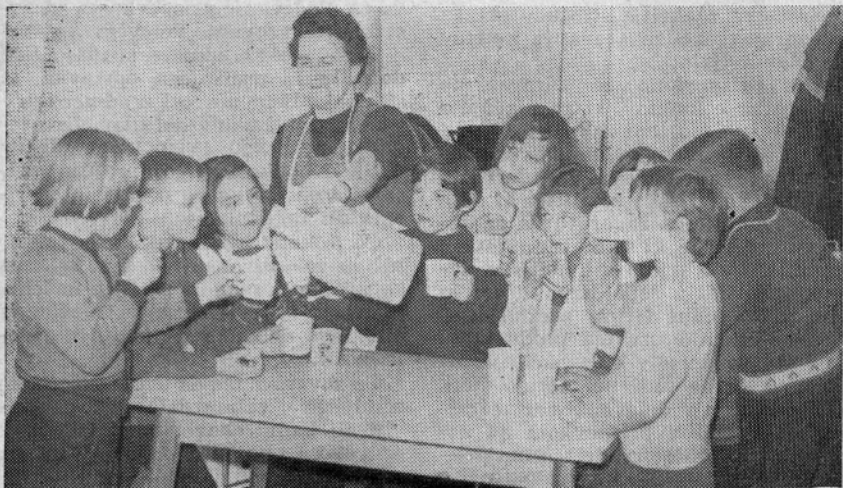
Pri delitvi obroka v šolski mlečni kuhinji v Laškem

skupnih petnajst, kolikor jih je v občini. V njih se je v istem obdobju hranilo 699 učencev, kar predstavlja le 27 % od vseh v občini v osnovno šolo vpisanih učencev. Že v naslednjem, to je šolskem letu 1966/67, je kuhinja delovala na 10 šolah. Od 2571 učencev osnovnih šol jih je v tem šolskem letu že prejemale malico 1243 ali 48,2 %. V tekočem šolskem letu pa deluje kuhinja že na 12 šolah, v njih pa se hrani kar 1583 učencev oziroma 63,5 % od vseh ki so v tem letu vpisani v osnovno šolo. Ta podatek pa je v času, ko to pišemo, še ugodnejši, saj je začela delovati kuhinja tudi na osnovni šoli