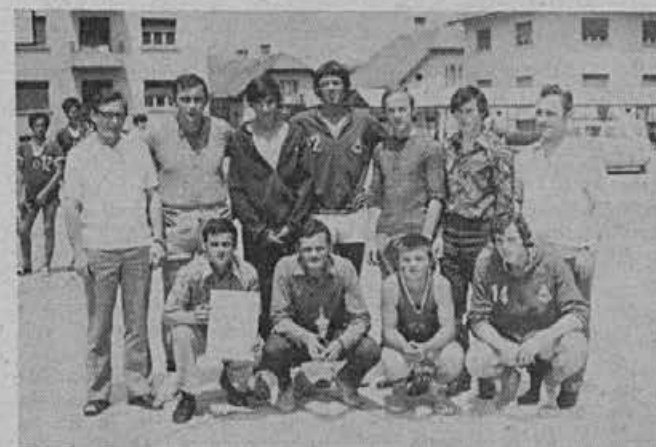
Ekipa košarkarjev Alpine

Odkar se je pričelo tekmovanje v I. zvezni košarkarski ligi, smo prek televizije lahko ocenili vrednost posameznih ekip. Trenutno je največ pokazala Lokomotiva iz Zagreba, ki ima tudi največ možnosti za osvojitve naslova jesenskega prvaka. Prognozirati, kdo bo končni prvak in kdo bo izpadel pa je zaenkrat še nemogoče, ker so vse ekipe izredno izenačene in ni prav nič presenetljivo, če zadnji na lestvici preмага prvega. Razplet tekmovanja v I. ligi z zanimanjem spremljajo tudi košarkarji Kladivarja, kajti v primeru, da se bo zvezna liga res povečala za dva člana, kot je bilo napovedano, imajo vse možnosti, da ostanejo v II. slovenski ligi — zahod še eno leto. Zato trenirajo po trikrat na teden.