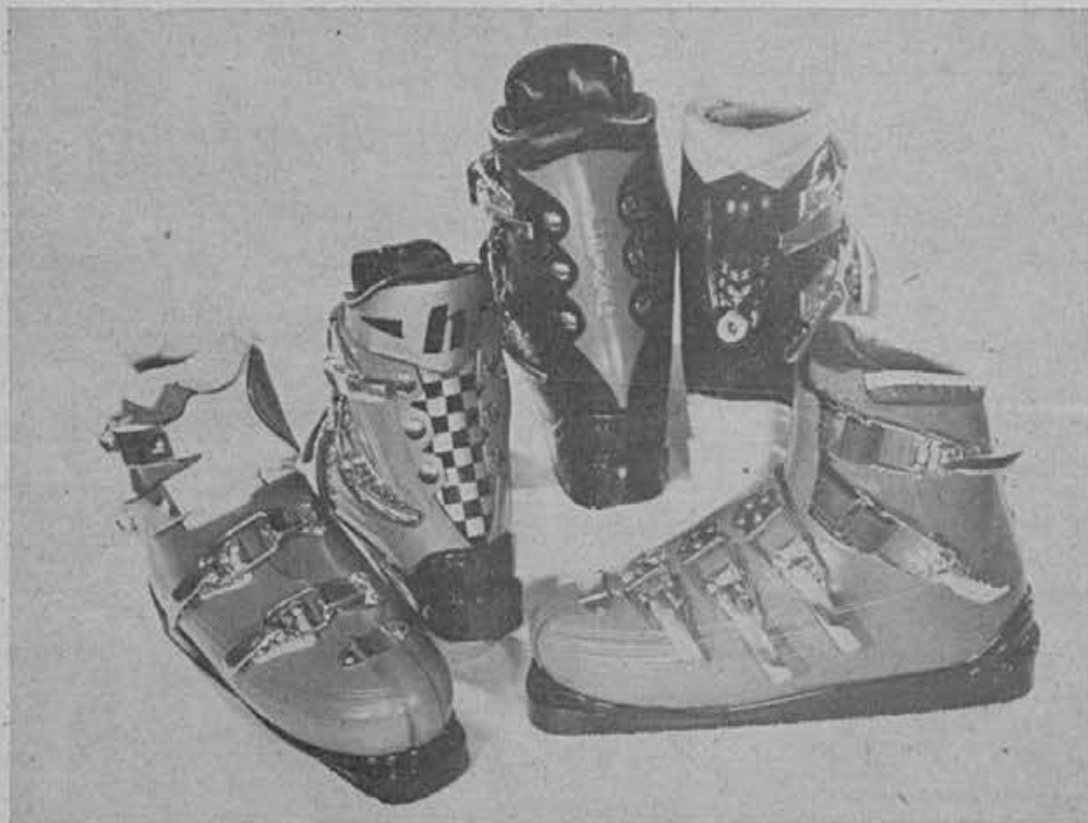
Najnovejši model smučarskih čevljev so naleteli na veliko zanimanje doma in v svetu.