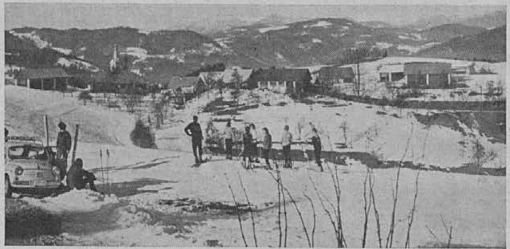
Smučišča na Goropekah so privlačna tudi v letošnji blagi zimi. Vlečnica je polno zaposlena.