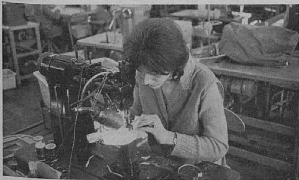
Od prešivalke se zahteva natančnost in brzina pri delu