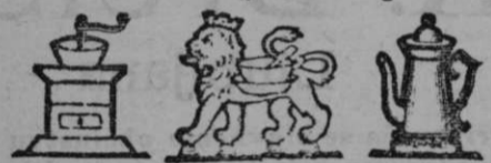
Tovarn. znamka. Tovarn. znamka. Tovarn. znamka.

da imate jamstvo za vedno jednako in naj- boljšo kakovost. — Pazite pri tem na varstvene znamke in podpis, kajti naše zamotanje se v jednakih barvah, papirju in z podobnim natisom ponareja. —