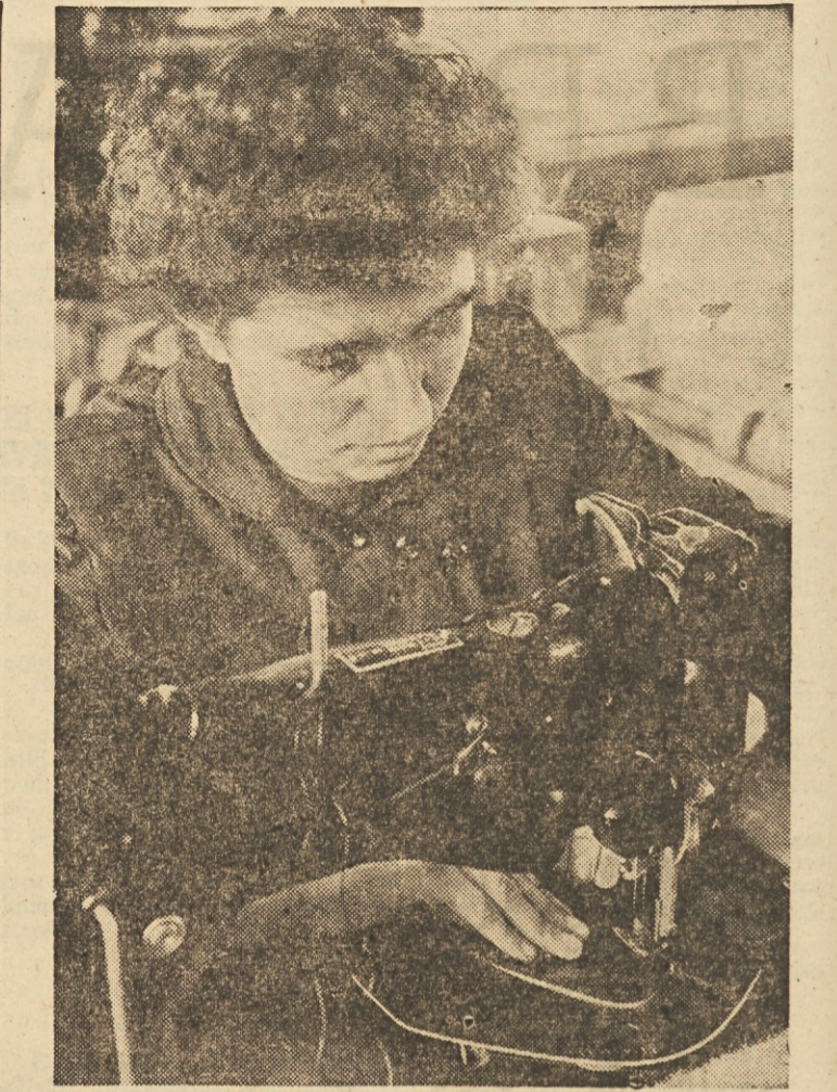
Poglejte, tole je »šivilja« v »Planiki«. Siva gornje dele čevljev. Letos bodo v »Planiki« izdelali, kot računajo, 545.000 parov čevljev.

Enaka načela veljajo za vse premijske upravičence in tudi za direktorja podjetja. Njegova premija je odvisna od izpolnitve plana, znižanja lastne cene podjetja, izpolnitve plana prometa in znižanja stroškov trgovskih poslovalnic podjetja in večjih ali