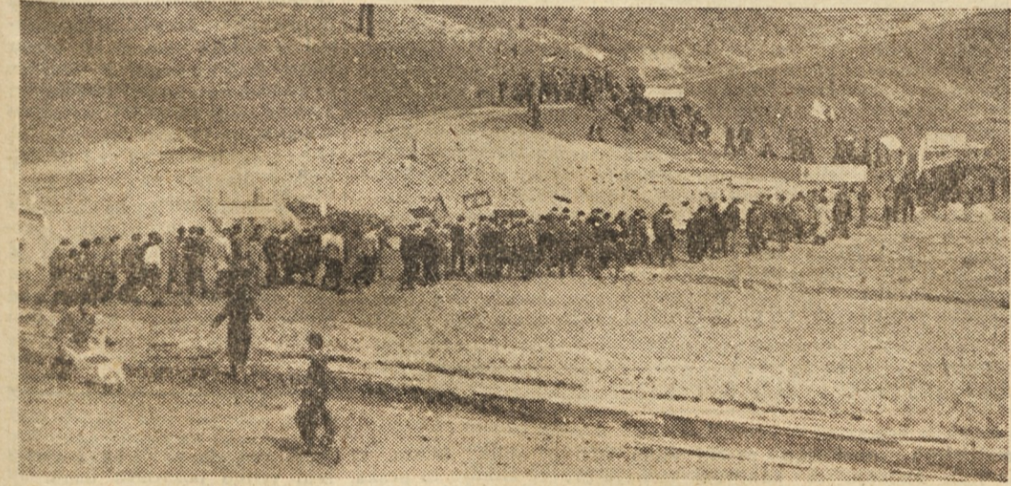
Delo, bratstvo, tovarištvo! Te misli so prevevale srca stotisočev brigadirjev, ki so v neslutnem delovnem poletu klesali nov obraz naše socialistične domovine. — Mladi brigadirji na ljubljanskem Strelišču

Naslednje jutro pa sta bila med prvimi v zboru.