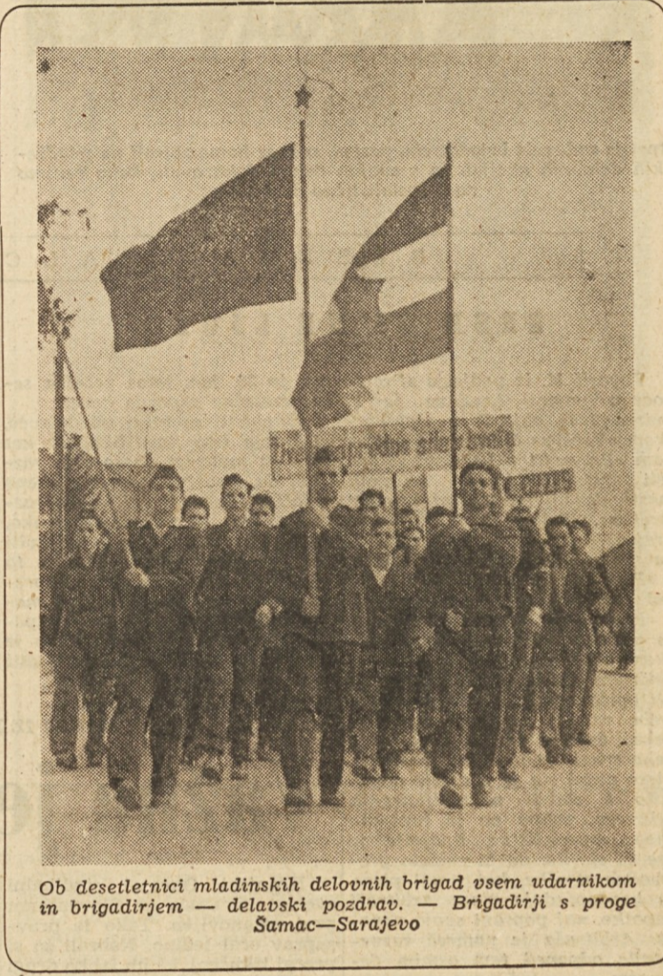
Ob desetletnici mladinskih delovnih brigad vsem udarnikom in brigadirjem — delavski pozdrav. — Brigadirji s proge Samac—Sarajevo