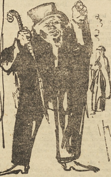
posled je zmajal z glavo in ju spravil v žep, rekoč: »mercic«.

Nesrečni Lev Savič je slišal ta »mercic«. Zvečer je stal pred Dulinovo izložbo, žugal s pestjo napisani tabli in mrmral ogorčeno: »Figar! Kramarska duša! Bedno ničel!«