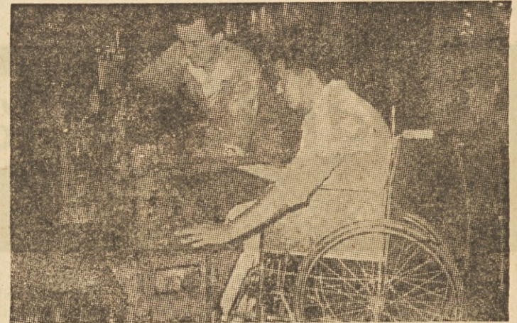
Invalid in mojster-instruktor v mehanični delavnici

V Mariboru so šli še dalje. Tovarna avtomobilov in še nekatera druga podjetja urejajo posebne oddelke za izučevanje invalidov. Podjetja bodo brezplačno odstopila stroje in delavnice. Tako vidimo, da se ponekod trudijo, kako bi omogočili invalidom primerno zaposlitev.