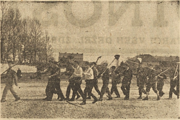
Spet je zadonela brigadirka pesem, spet se bomo zbirali na mladinskih delovnih akcijah in s svojim delom dokazovali, kako cenimo našo socialistično domovino