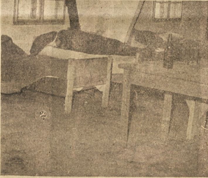
Mrčes je nosilec mnogih bolezni. Nečista in neurejena stanovanja so legla mrčesa. Z redno in čistočo v stanovanju pa zmanjšamo nevarnost nalezljivih bolezni, ki jih širi mrčes

Člani skupščine so se tudi pogovorili o nabavi rentgenskega aparata in nadzidavi ambulante. Še letos bodo začeli z nadzidavo. Rentgenskega aparata pa zaradi pomanjkanja denarnih sredstev še ne morejo kupiti. V Ločah bodo namestili rednega zdravnika in s tem olajšali delo zdravnikom v Konjicah. L. V.