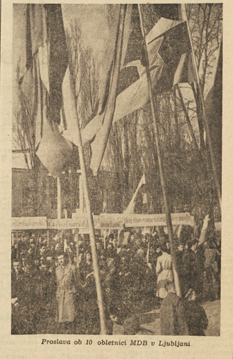
Proslava ob 10 obletnici MDB v Ljubljani

Vzela sta lopate in se spet odpravila k reki. Nalagala sta komandirja, da v njuni četi nimajo prostora in da bi rada delala pri njih. Komandir ju je določil k samokolicam. Slaba vest in pa jeza sta ju tako raznela, da sta začela vpiti: Dajmo, dajmo... Kaj se opletate... Hura... Hura... Raznela sta tudi ostale brigadirje.