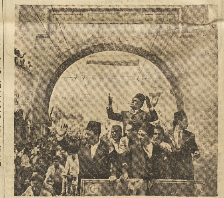
Tunis pozdravlja Habiba Burgibo

Čilsko sindikalno gibanje je enotno. Napredni sindikalni voditelji so pred leti ustanovili Enotno sindikalno konfederacijo, ki ni vključena v nobeni mednarodni sindikalni zvezi. V konfederaciji sodelujejo komunisti, socialisti in pristaši drugih političnih strank. S svojo dosedanjjo aktivnostjo je še čilska sindikalna zveza uveljavila kot pomembna družbena sila, ki odločno in tudi uspešno brani pravice proletariata in revnih slojev.