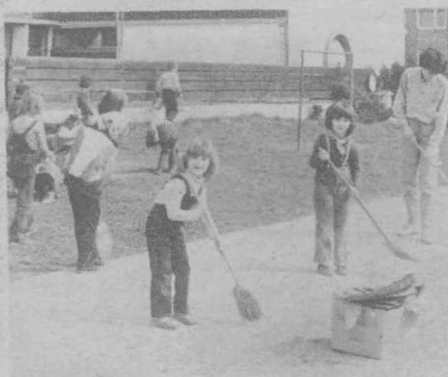
Tudi mlajši iz VVO Otona Župančiča se vključujejo v akcijo za čisto in zeleno Ljubljano