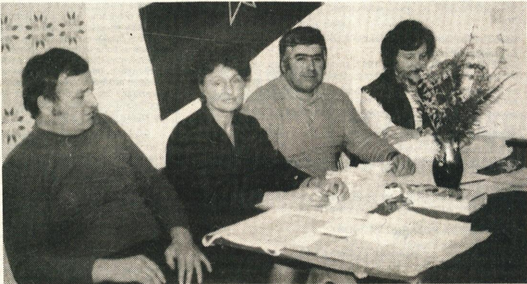
Fotografija je nastala na enem od volišč, kjer so lahko ponosni na dobro udeležbo