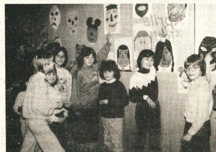
V Cankarjevi knjižnici so šolarji izdelovali tudi maske

V Cankarjevem domu so bile predstave razdeljene na razredno in predmetno stopnjo in je bilo skupno 871 obiskovalcev filmskih predstav. Slabše je bila obiskana lutkovna predstava, saj si jo je ogledalo le 47 otrok. Torej je Cankarjev dom gostil 918 šoloobveznih otrok, neupoštevajoč polno zasebene lutkovne sobe, kjer so se prizadevne mentorice morale dogovoriti za dodatne termine za izdelovanje lutk, saj 15 do 20 otrokom 90 minut po dvakrat na teden ni zadoščalo. Izdelane lutke so izde-