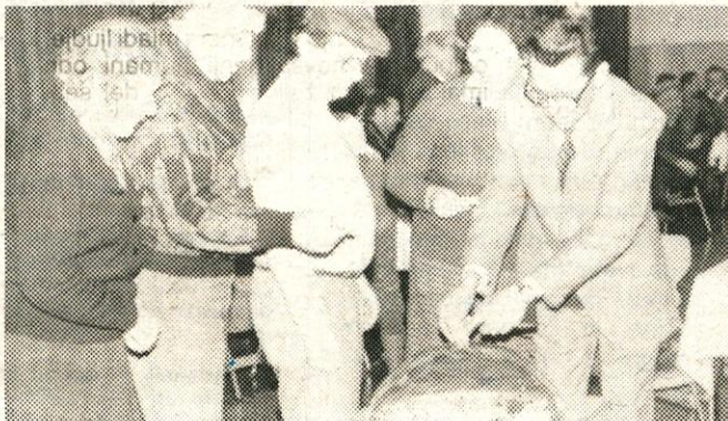
Na letni skupščini so tudi sami zbirali prostovoljne prispevke

V letu 1987 so v dveh rednih terminih in enem dodatnem imeli v teh hišicah 14 oseb. Stroške bivanja je v celoti kriilo Društvo. V jesenskem času, torej v času ozimnice, so 29 članom omogočili nakup ozimnice. Ob Novem letu je bilo opravljenih 41 obiskov najtežjih invalidov, ki so bili tudi skromno obdarjeni. Pri tej akciji je finančno sodeloval OS ZS Vrhnika, za kar se Izvršni odbor Društva iskreno zahvaljuje. V minulem letu je bilo izdanih nekaj potrdil za brezplačno pravno pomoč, začeli so iskati zaposlitve za invalidko brez nog in se vključili v razreševanje stanovanjskega problema članice, priključene na invalidski voziček.