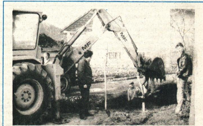
Na Sivkini so »komunalci« pred časom zamenjali vodovodne cevi zdaj, ko je vreme ugodno pa vgrajujejo še nove priključke

Program je zdaj pripravljen in konec februarja bodo že prva strokovna predavanja.