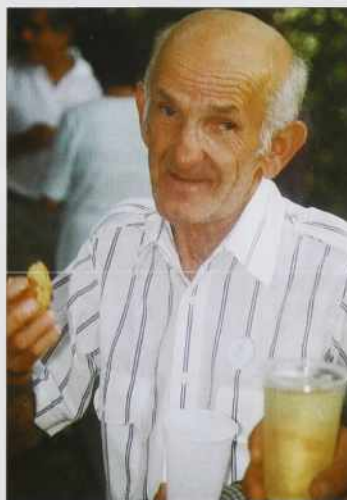
„Dun sam lado gor priti“ – pravijo Fartek bači