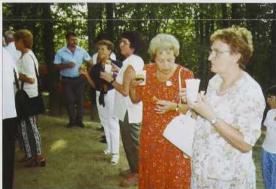
Jaj, kak so dobre ocvirkove pogače..."