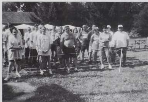
Ekipa so postavlene.

pobere civilne organizacije pa organizira vaške igre. Letos so se tauj prireditvi pridružili gasilci, folklorna skupina, pevski zbor, športniki pa ekipa (csapat) Cifer krčme.