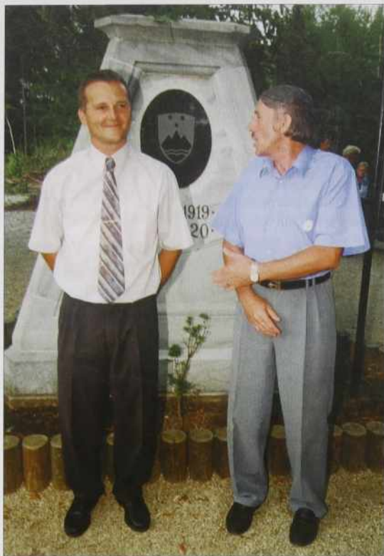
Tromejnik s slovenskim grbom pa dvöma žüpanoma.