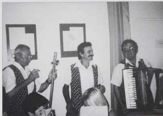
Z veseljem so igrali v družtvi tó.

imela nastop na Karnevalu Savaria . Med publiko so nej bili samo člani slovenskoga društva, liki dosta lüdi ji je gledalo pa poslušalo, šteri so prišli na Karneval. Karneval Savaria so organizirali oprvim v 1960-1 lejtaj. Leta 2000- po 31 lejtaj - so obnavili tau