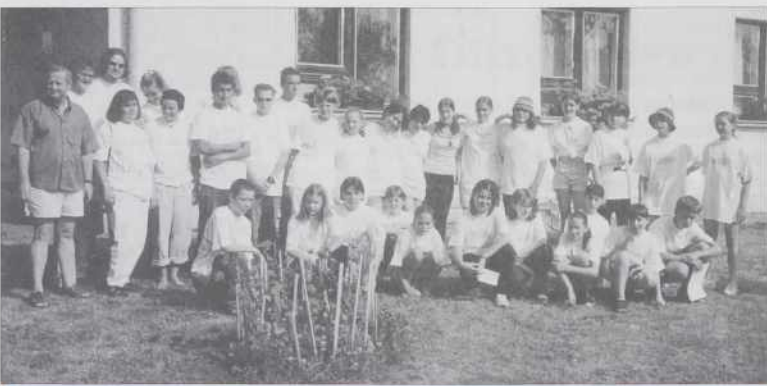
Vsi udeleženci kolonije.

Letošnja kolonija je potekala od 19. do 25. avgusta v čudovitem, mirnem okolju v gostišču "Ružič" na Verici. Na razpis Zveze Slovencev na Madžarskem se je prijavilo 26 udeležencev. Dve udeleženci sta sicer odpovedali, vseeno jih je bilo 26, ker sta namesto njihju prišla dva nova: eno dekle iz Celja pa fant z Verice. Dopolndanske delavnice so vodili štirje likovni pedagogi. Pri njihovem delu so pomagali štirje spremljevalci. Udeleženci so bili res pridni, navdušeno so delali in veliko lepih stvari je prišlo izpod njihovih rok.