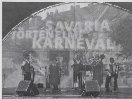
Pristavške ščuke na Karnevalu Savaria.

Sombotel skupino muzikan-tov in pevcev iz Slovenije, Pristavške ščuke . Zatok so si tau imé vódebrali, ka so v njenom potoki nejdavnik eške plavale te ribe (csukák). Zvün fud so vse škeri sami naredli, aj pa doma najšli. Igrali so na žago s pilo, na podkev,