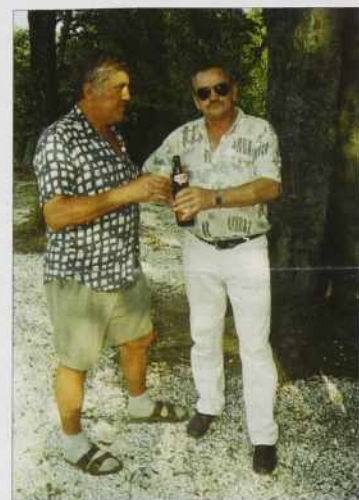
„Vej si pa müva tau pivo leko razdeliva...“