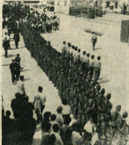
Častni gostje in odred predvojaške vzgoje na moravški proslavi