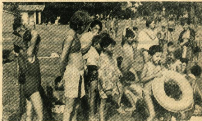
Nad 300 otrok iz naše občine je tudi letos letovalo v Izoli in v Izlakah

Občani, ki morda še mislijo, da je mesto obrtnih delavnic, zraven ostalega tudi v nudenju uslug, se motijo, prav tako pa se verjetno moti tudi občinska uprava za dohodke, ki prav gotovo še ni zvedela od tega mojstra, da se bavi »samo z velikimi rečmi.«