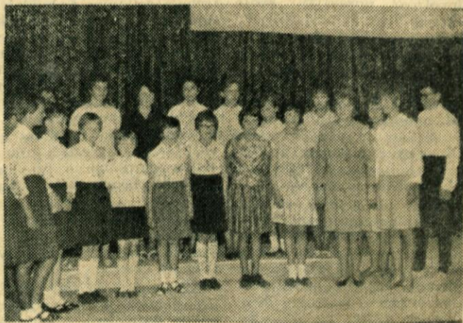
S prireditve ob Dnevu krvodajalcev — Moraški mladinski pevski zbor

dvorani prostovoljni krvodajalci iz Domžal, mengeške ravnine, Črnega grabna in cele moravške doline, z namenom, da proslavijo vsakoletni dan krvodajalstva. V okviru 20. obletni-