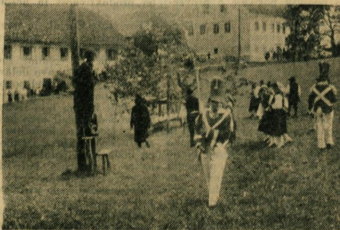
»Francozi« na Brdu in »Obložki Tonček« na sramotilnem odru

vodilo Turistično olepševalno društvo Lukovica, pomagali pa so še člani drugih društev, vsega nad 70 ljudi. Najbolj zanimivo pa je, da ni bilo treba nobenih denarnih in drugačnih pomoči od drugod, ampak so vse uredili člani društev iz lukoviškega okoliša sami. Prometa je bilo okrog 4.000.000 din, kar pa ni nič čudno, ker sta v gozdičku delovali dve kuhinji, kavarna, paviljon za informacije, 4 paviljoni za pijače ter onstran travnika ob robu bližnjega gozda še rokovnjaški brolg. Gostje so se lahko zabavali v gozdu ali na travniku v pestri naravi in ob lepem vremenu. Manjkalo ni ničesar, ker so bili vsi paviljoni bogato založeni.