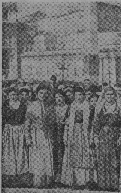
Italijanska kmečka dekleta čakajo v Rimu pred Vatikanom na razglasitev izvolitve novega papeža

Pobrežje pri Mariboru. Pobrežani se bolj redko oglašamo. Tih delamo in čuvamo avtoriteto naše republike. Tišina na Pobrežju pa je le navidezna. Hočete dejstev? Društveno delovanje v slovenskem in katoliškem smislu, ki je zdaj na Pobrežju zelo razgibano, ne gre vsem v nos. Proti našim društvom se je začela očitna in načrtna propaganda — ne, to ni propaganda, to je pobalinstvo! Niti en naš lepak ali vabilo k pri-