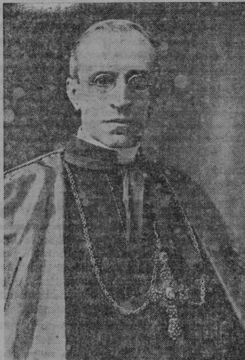
Novi papež Pij XII.

»Slomškova družina« Maribor, Koroška cesta 5