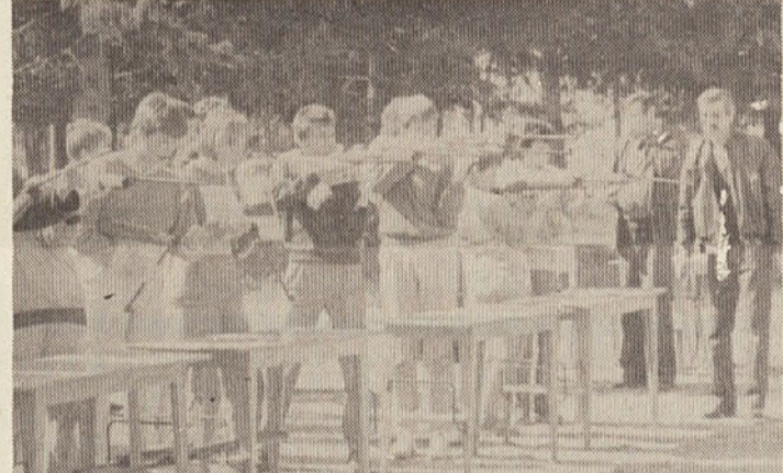
Občinsko tekmovanje »Mladi v SLO in DS« je organizirala OŠ Zbora odposlancev Kočevje v sodelovanju z občinsko gasilsko zvezo, občinsko strelsko zvezo, občinskim odborom ZRVS, občinskim odborom RK in Zdravstvenim domom Kočevje. Tekmovanja se je udeležilo 56 ekip mladih.

Delovni čas za stranke kemične čistilnice in Butika bo: vsak dan razen sobote od 7.—15. ure in od 17.—19. ure.