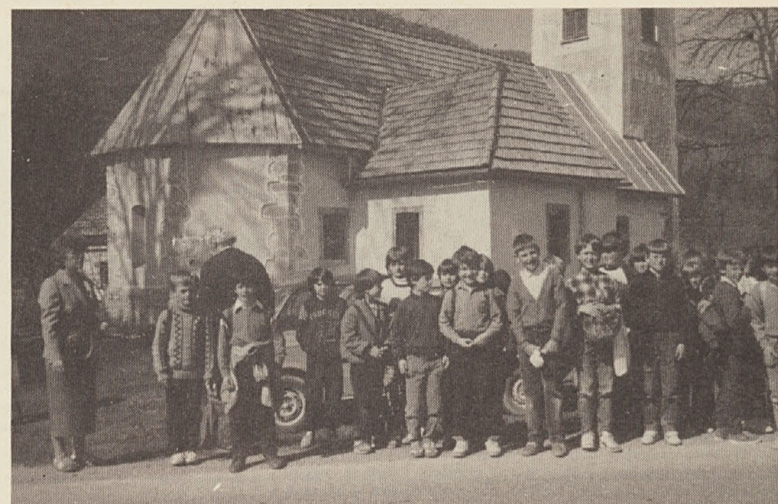
Šolska mladina in tovarišice iz Livolda so organizirali akcijo čiščenja okolice. V njej je sodelovalo 64 mladincev, tovarišice učiteljice in nekaj vaščanov, ki so odvažali smeti. Očistili so 5 km roba ob cesti proti Dolgi vasi, Zajčjemu polju in proti Mozlju.

Tudi v letošnjem letu so sprejeli obširen program dela, ki ga želijo ob vključevanju novih članov uresničiti. Načrtujejo, da bodo v drugi polovici julija priredili gasilsko veselico. Če bo kaj ostanka dohodka, ga bodo tudi namenili za gasilsko dejavnost.