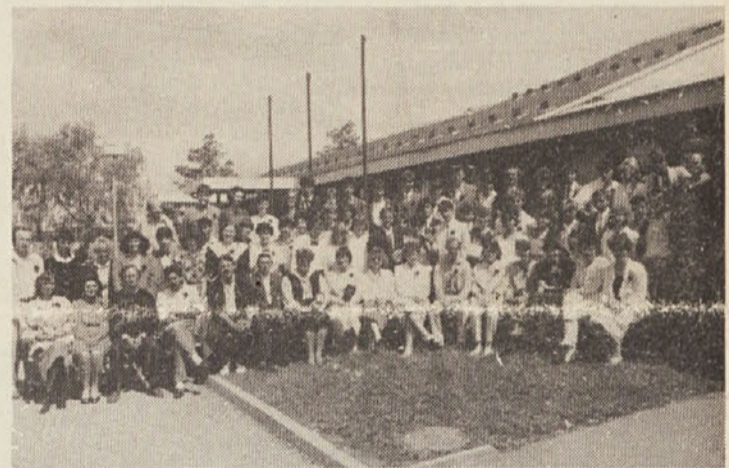
Učenci kovinarstva in strojništva ter družboslovno-jezikoslovne dejavnosti ob zaključku 4. razreda šolanja v Kočevju v šolskem letu 1986/1987. Večina od njih se je odločila za nadaljevanje izobraževanja na višjih oz. visokih šolah.