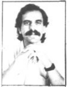
Piše: Jože Kranjc

Domačini so zmogli dovolj dostojanstva da so cerkev kratkoma zaprli in poskusili še na ta način. Če do 23. avgusta pri pristojnih bogovih ne bodo uslišani v svojih zahtevah, bo cerkev ostala zaklenjena, so pribili. Zahtevajo usklajevanje škofijskih mej z državnimi, priključitev slovenskega dela razkriške župnije mariborski škofiji, slovenski ve-rouk, slovensko bogosluzje in slovensko komuniciranje v župnijskem uradu. Je na