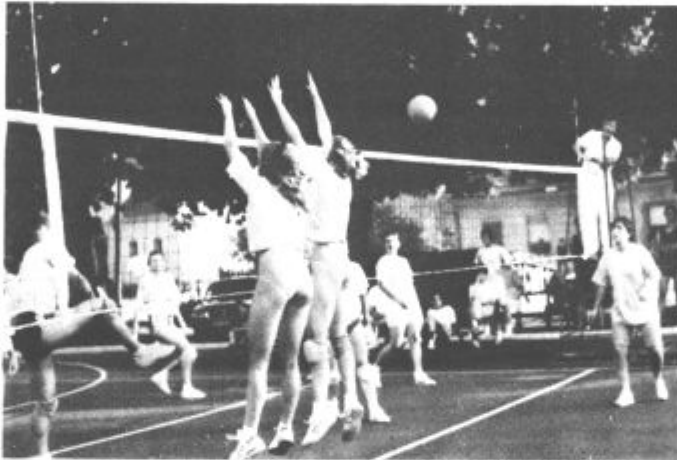
Na prenovljenem športnem igrišču so ljubitelji odbojke prišli na račun

Rezultati — fantje: Topolšćanka:Velenje 1:2, Šempeter I:Šempeter veterani 2:0, Šempeter veterani:Braslovče 0:2, Ljubno:Velenje 0:2, Braslovče:Šempeter I 1:2, Ljubno:Topolšćanka 0:2, v odločilni tekmi je Šempeter I po hudem boju premagal Velenje z 2:1 (14, —9, 14); dekleta: Ljubno: Braslovče 2:0, Topolšćanka:Prevalje 2:0, Braslovče:Prevalje 1:2 in v finalu Ljubno:Topolšćanka 0:2 (—10, —13), tretje so bile Prevalje in četrte Braslovče. (jp)