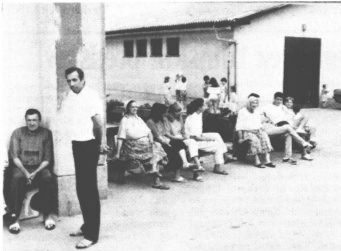
Zbirna centra Golte in Brdce

nam pred zlom in gorjem. Otroški živ-žav se razlega po hodnikih, v sobah, v okolici doma. Razposajenost, a hkrati otožni in globoki pogledi pri mnogih dokazujejo, da so že odrasli. Obrazi njihovih mater so zaskrbljeni, njihova notranjost prežeta s skrbjo za dom, svoje najdražje. »Nič nam ne manjka,« pravijo. »Imamo streho nad glavo, mir, urejeno preskrbo s hrano in kolikor toliko tudi s potrebščinami za osebno higieno. Toda, dom je le dom. Nikjer ne more biti lepše, pa čeprav se drugi še toliko trudijo. Imamo praktično vse in nič.« Ta nič ni nevhvaležnost. Je le mora negotovosti, njihove vsekakor ne lepe prihodnosti. Kljub temu si želijo čimprej domov. Čeprav na ruševine ali pa jih ne bodo pričakale niti te. Iskrica upanja, da bo to kmalu, ostaja. Z njo žalje prenašajo tegobe vsakdanjosti. Resnici na ljubo, kar mnogim je bila skrb za red in disciplino v začetku tuja. Danes temu v mnogih primerih ni več tako. Lagali bi, če bi pisali o zadovoljstvu vseh, da bo to omenjamo še kakšnih drugih zadev. Dejstva so tu in so takšna kakršna pač so. Z njimi se je sicer težko sprijazniti. Toda, hočeš ali nečeš, treba se je.