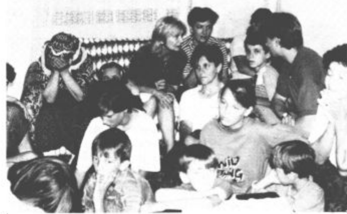
Imajo vse, a nimajo ničesar

problem begunci v zbirnih centrih. Večji problem zaradi prenapolnjenosti zmogljivosti postajajo tisti, ki žive pri družinah. Gostiti v dvo ali trosobnem stanovanju tudi več kot 20 ljudi in to toliko časa presega vse meje. Takim družinam lahko pomagajo le s prehrabnimi paketi, razdelijo pa jih vsakih 14 dni. Napetost v družinah raste iz več razlogov in ni malo takih primerov, ko gostitelji dobesedno čez prag postavijo tiste, ki so jih pred dvema, tremi meseci sprejeli. Bojijo se dni, če se vojna vihra na ozemlju BiH ne bo kmalu podela. Bojijo se jeseni, zime, vse večjih obremenitev, nakopičenih življenjskih stisk