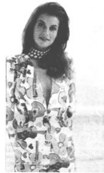
sojne tkanine, ki jih lahko kombiniramo ravno ob takih modelih...

Če je krilo daljše, midi torej, so obvezni visoki razporki, še vedno ostajajo aktualne pro-