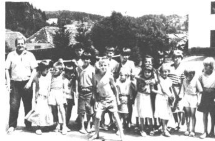
Na Brdcah je vendarle malo lažje, otroški živ-žav še večji