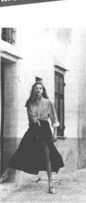
Ob dnevih, ki jih preživljamo zadnje čase, človek skoraj