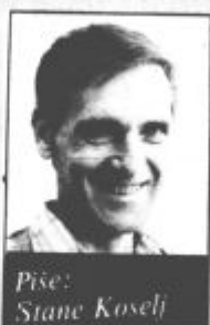
Piše: Stane Koselj

Ne odlašaj na jutri, kar lahko storiš danes... pravi pregovor. V njem se skriva velika modrost. Da je to res, se boste kmalu prepričali: