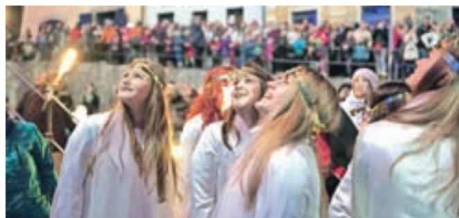
Miklavža so spremljali tudi angelčki ...