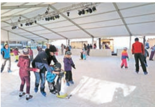
Dršališče je še posebej dobro obiskano ob koncih tedna.

Dršališče je polno predvsem ob koncih tedna, ko na drsalni ploskvi ne manjka tudi