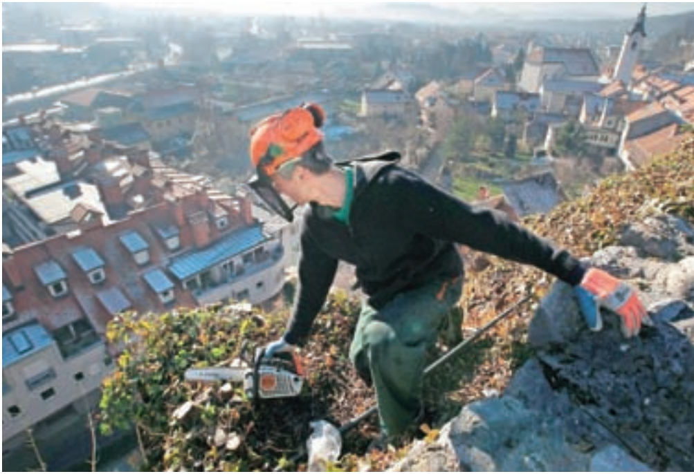
Dela na strmem pobočju zahtevajo dobro usposobljene izvajalce.

Poleg zaščite severnega pobočja Malega gradu bodo predvidoma še vse do božiča izvajali tudi čiščenje celotnega pobočja Malega gradu, ki zajema odstranjevanje