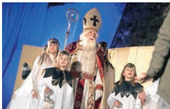
Tudi letos je kamniške otroke obdaroval Miklavž.

Ko je Miklavž počasi praznil malho daril, so se prizadevni člani društva iz Tunjic že ozirali v prihodnje leto, ko bodo Miklavžu že tridesetih pomagale najti pot do kamniških otrok. »Razmišljamo o pripravi muzikala, ki bi ga radi ponovno umestili v čaroben ambient pobočja Ma-