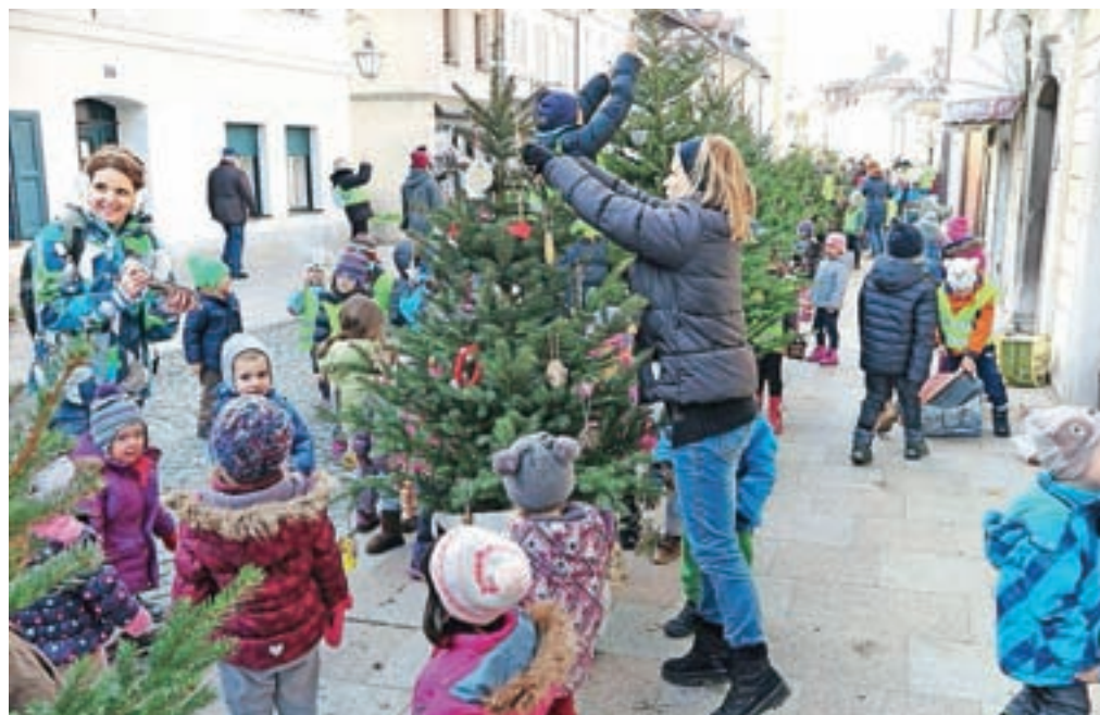
Drevesca na Šutni so okrasili otroci kamniških vrtcev in šol.

Otroci so pod vodstvom vzgojiteljic in učiteljic izdelali okraske, ponekod pa so k temu zabavnemu opravilu povabili tudi dedke in babice, tako da so otroci okraske izdelovali tudi doma. Kot denimo v Zasebnem vrtcu Peter Pan.