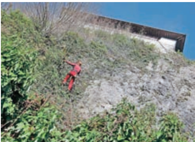
Pobočje malega gradu bodo zaščitili z mrežami in očistili nizke podrasti.

obzidja, a šele prihodnje leto, saj zaradi nizkih temperatur izvajalci ne morejo več zagotoviti ustreznosti del.