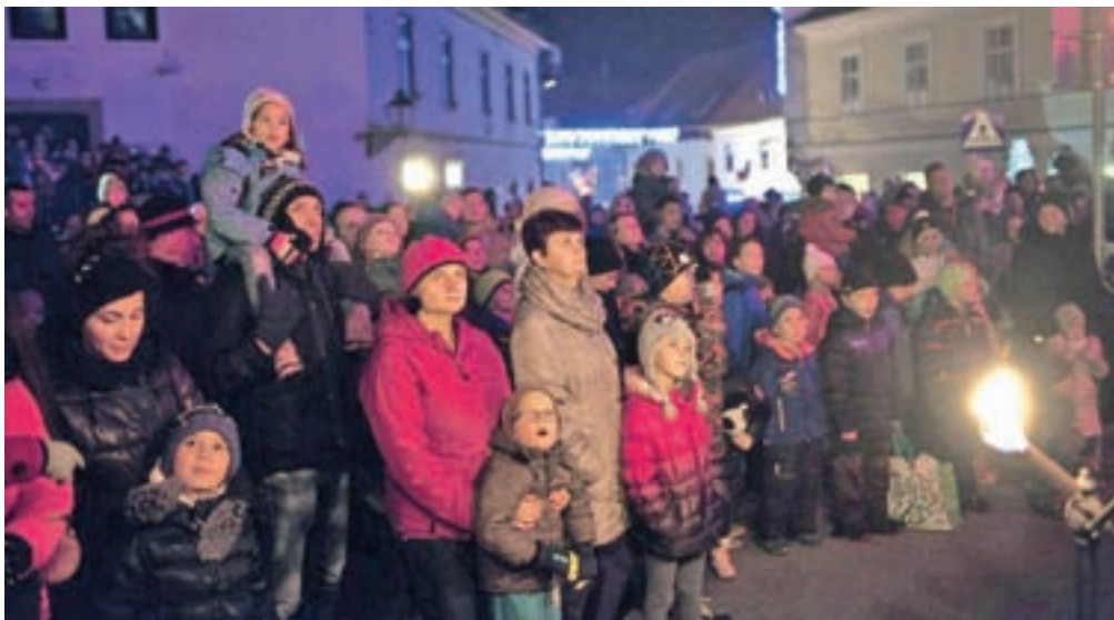
Nad obiskom Miklavža so bili najbolj navdušeni najmlajši.