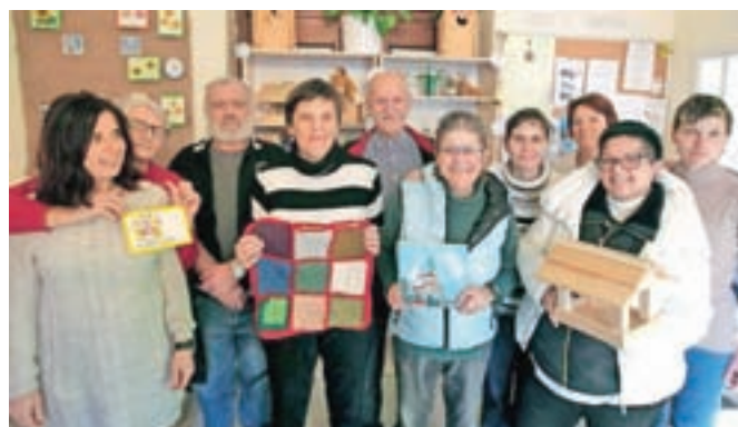
Uporabniki in zaposleni Dnevnega centra Štacion so tudi letos dokazali, da imajo zelo spretno roke.

kov, ki so jih sami izdelali preko celega leta. Kot so nam povedali, je bil odziv obiskovalcev tudi letos dober, največ povpraševanja pa je bilo po čajih, marmeladah, obeških, predpasnikih, voščilnicah ... Prostovoljne prispevke, ki so jih zbirali v zameno za izdelke, bodo namenili za delovanje centra, z veseljem pa bodo ustvarjali tudi v prihodnje, še pravijo.