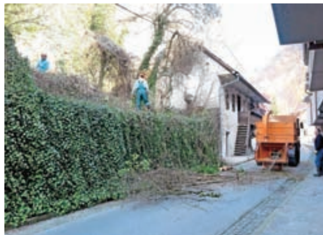
Zaradi mletja podrasti bodo na Parmovi ulici še nekaj dni občasne popolne zapore prometa.