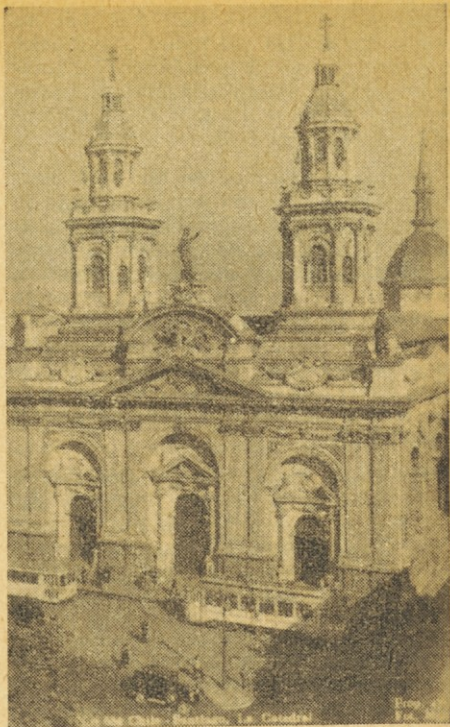
Stolnica v Santiago de Chile

Ist dan so naši fantje, organizirani v Slovenski fantovski zvezi (SFZ) pri- redili v društvenih prostorih na pristavi v Moronu svoj božičnj sestanek. Udele- žilo se ga je nad 70 fantov. En teden preje so na istem prostoru imele enak