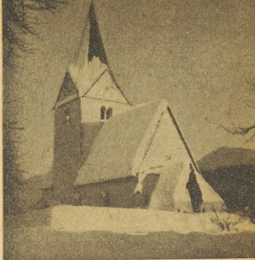
Bilčovs na Koroškem

Tudi domača pesem naj bo naša zvesta spremljevalka. Hvalevredni dar božji je, da smo Slovenci prijatelji pesmi in petja. Tega velikega daru se bomo v