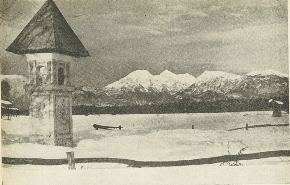
Poljsko znamenje s Kamniškimi planinami v ozadju