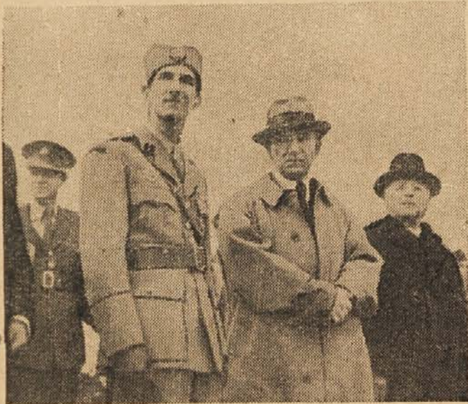
Nj. Vel. Kralj. Peter II. v družbi predsednika češkoslovaške republike, dr. Beneša na obisku češkoslovaške vojske na Angleškem

ta vremena. To naš Kralj nije mogao dopustiti, i zato je, prilikom stupanja na presto, svoj narod poveo putem kojim su vazda išli Njegovi veliki pretci, a to je putem pravde i slobode. Ostajući verni našim oprobanim saveznicima, odlučni da sa njima podijelimo patnje i tegobe, ali isto tako i pobjedu i slavu, kao i blagodeti krvavo plaćenog mira.