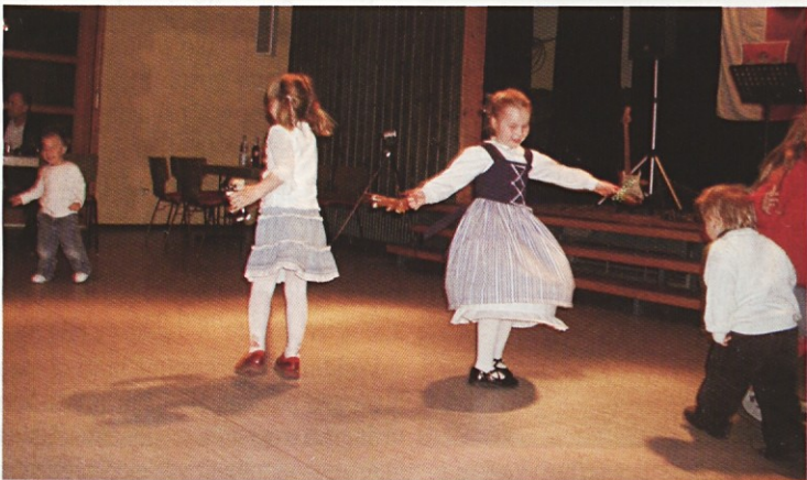
Male balerine v Mannheimu