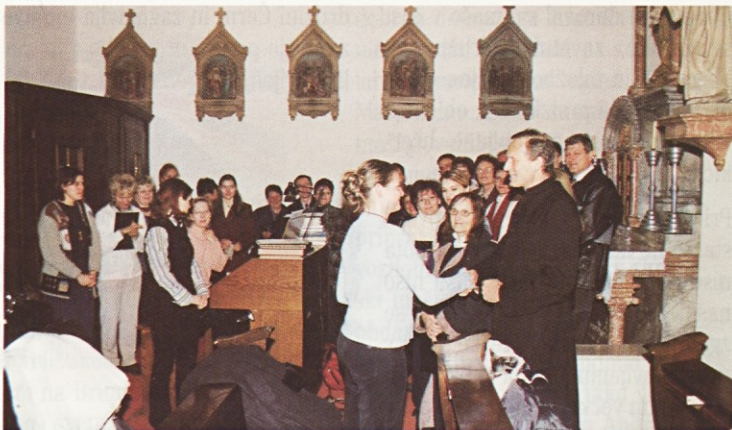
"Martinčki" – pevski zbor župnije svetega Martina iz Velenja je zelo lepo prepeval med mašo in po njej.

gr. Zdešar povedal o tem bogatem sporočilu nekaj več, kar je med nami sprožilo plaz neštetih vprašanj.