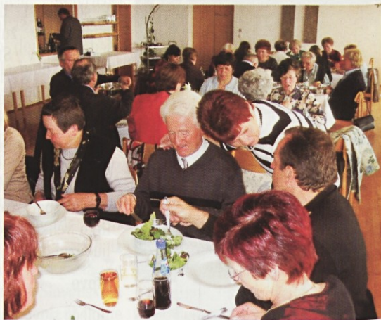
Na duhovni obnovi smo potrebovali tudi telesno hrano.