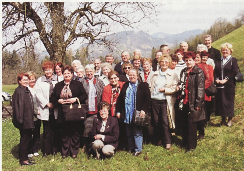
Rojaki iz Avstrije, Švice, Liechtensteina in Nemčije so se zbrali na duhovni obnovi na Predarlskem.