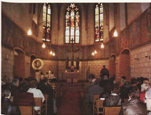
Med romarsko mašo v Marienthalu