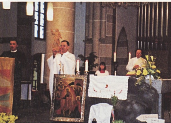
(Essen) Aleluja pred pričetkom velikonočne procesije

Potem me je ata vprašal, če sem pred odhodom lahko kaj videl mamu. Čisto sem pozabil, da ata ni mogel vedeti o maminem odhodu. Povedal sem mu, da je tudi ona med begunci. Ni mogel verjeti. Trdno je bil prepričan, da sta mama in teta ostali doma. Vest, da sta zdaj nekje na cesti, ga je silno potrla. Ko sem mu povedal, da sta se pozno popoldne še odpravljali od doma, a da sta bili namenjeni oditi s skupino sosedov, se mi je zdelo, da se je skrušil: »Kje hodita zdaj ubogi revi...« Potem pa me je pogledal in rekel vdano: »Je že božja volja.« Ni mi očital, da sem mami svetoval, naj gre, a videl sem, da on tega ne bi storil. Dotlej je bil videti pogumen, zdaj pa mu je legla na obraz skrb.