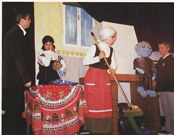
Radijski oder iz Trsta, na gostovanju v dvorani J. Flisa, med Slovenci v Parizu

venec. Proti jutru je prišel v smeri od Tržiča mimo njih manjši oddelek domobrancev in odšel skozi predor. Verjetno so bili izvidnica. Niso se vrnili. Morda so bili v zasedi na koroški strani.