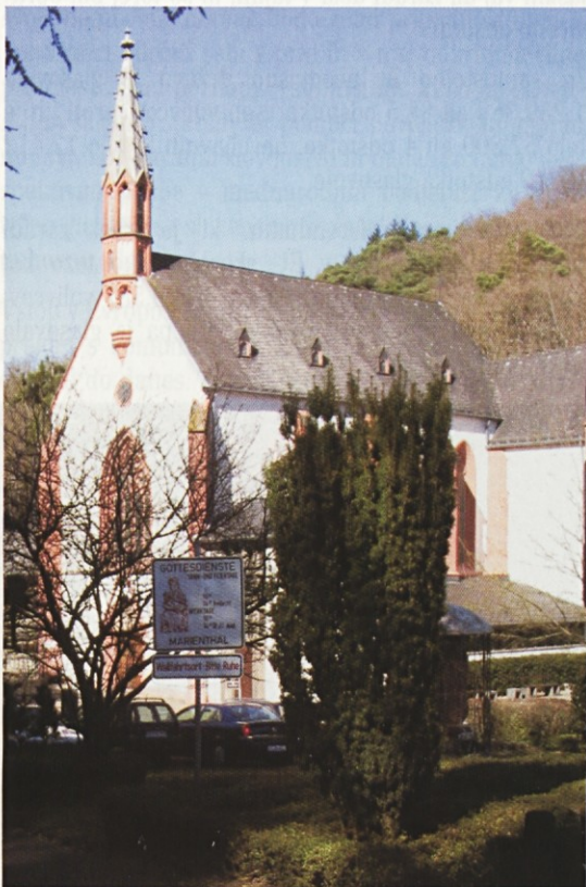
Romarska cerkev v Marienthalu

Po njegovih besedah so se Slovenci za vstop v Evropsko unijo in zvezo Nato odločili "bolj z ozirom na strateške interese Slovenije, kot glede na trenutne politične razmere, ki jih je posebej zaznamovala vojna v Iraku." Po njegovem mnenju bo imel rezultat referendumov pozitivne posledice tako doma kot v članicah Unije, zato nikakor ne bi smela pasti dinamika