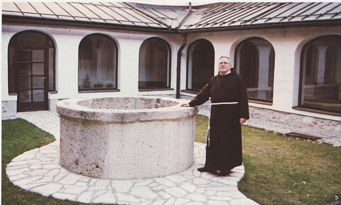
P. Robert v atriju samostana v Škofji Loki

Švica ima dva obraza. Tistega, ki ga kaže navzven, in tistega, ki ga doživlja tujec na delu. Navzven je to obljubljena dežela, ki magično privlači tujo delovno silo, navznoter pa odklonilna do tujih delavcev, čeprav brez njih ne more preživeti. Zaželena je samo mlada in zdrava delovna sila. Ko si enkrat izčrpan, ostarel, bolan, je najbolje, da se vrneš, od koder si prišel. Mimo so časi, ko se je dalo kaj privarčevati, sedaj se živi iz meseca v mesec, mesečna renta skoraj ne zadošča za preživetja. Slovenija še vedno ni dovolj