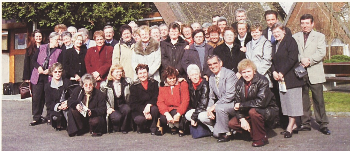
(Švica) Po maši pred cerkvijo v Birrfeldu

Čprav je moral biti predor nekje blizu, je bil trenutno najin cilj travnik. Cesta je bila zabasana z vozili, ob njej je stalo nekaj avtomobilov, po sredi so konji ob kričanju in vzpodbujanju voznikov s težavo vlekli za seboj vozove, med njimi se je pomikalo nekaj velikih tovornjakov in nama zastiralo pogled. Prav ko sem nameraval prehiteti enega od teh, zaslišim, da me nekdo kliče. Glas je bil nedvomno ženski.