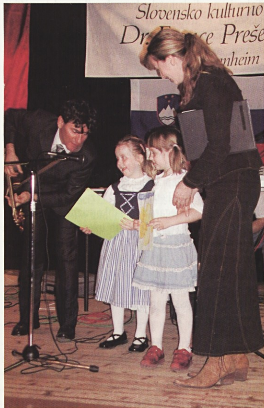
(Mannheim) Kim in Cindy sta nam zapeli.

Slovinci zunaj meja domovine se ob vsakih volitvah še vedno soočajo s številnimi težavami, ki otežujejo uveljavljanje njihovih z ustavo zagotovljenih volilnih pravic. Večino vprašanj, na katera opozarjajo slovenski izseljenci ob izvedbi volitev, naj bi rešili v nastajajočem zakonu o odnosih Republike Slovenije s Slovenci, ki živijo zunaj njenih meja oziroma z nekaterimi manjšimi načrtovanimi spremembami področne volilne zakonodaje. Med drugim naj bi težave, ki so se doslej pojavljale v primeru glasovanja po pošti iz tujine, rešili z uvedbo takoimenovane prazne glasovnice. Razmišljajo tudi, da bi v času volitev v posamezni državi ustanovili leteče konzulate, kjer bi lahko slovenski izseljenci - poleg volišč na posameznih slovenskih predstavništvih - uresničili svojo volilno pravico.