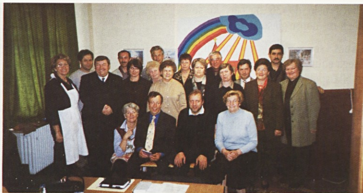
Zavzeti člani za dobro naše slovenske cerkve v Stuttgartu in okolici

pričakovanju Kristusovega vstajenja. Nekateri motivi so tipično slovenski, zato lažje nagovorijo tiste plasti verskega doživljanja, ki so globoko vtisnjene v naše duše.