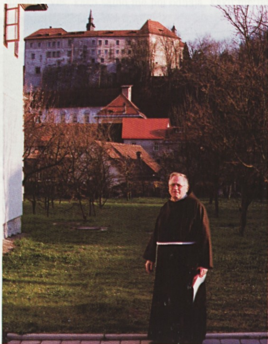
Na vrtu samostana v Škofji Loki