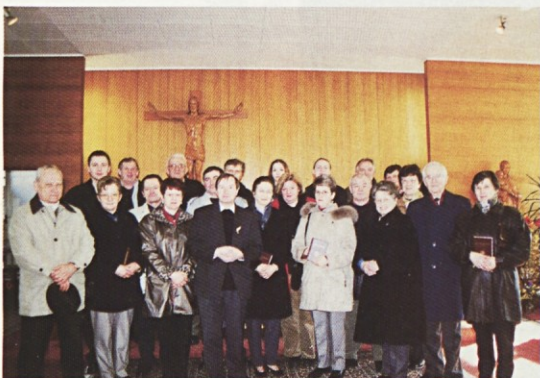
(Mannheim) Po slovenski maši v kapeli Marija Frieden

Ura je morala biti okrog enajstih in sonce je že kar pripekalo, ko sva rinila kolesi proti cerkvi sv. Ane, kjer je moralo biti prav takrat konec maše. Bilo je videti kakor v nedeljo na kaki večji fari, pa je sveta Ana komaj podružnica. Begunci, ki so počivali in taborili tam okoli, so se usuli iz cerkvice. Čprav na poti v