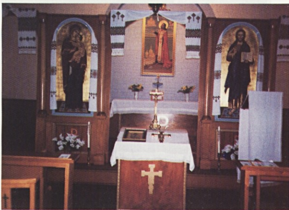
(Bedford) Ukrajinska cerkev sv. Jozafata, kjer imamo Slovenci vsako leto velikonočno vigilijo.

Na nedeljskem referendumu, ki je imel zaradi vprašanja o članstvu v EU skoraj enako težo kot plebiscit, je imelo volilno pravico 1.609.587 volivcev. Na referendumu o včlanitvi v Nato pa je glasovalo nekaj manj volivcev.