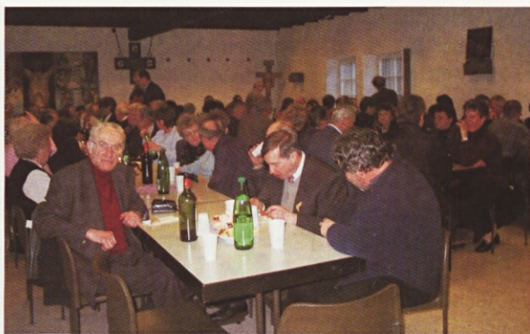
Pogled na polno dvorano v Marienthalu