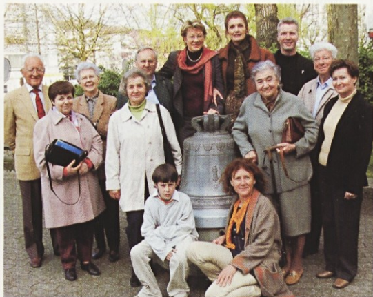
V Ženevi znova začenjamo s slovenskimi mašami in Bog daj, da bi vztrajali

Da je vse skupaj dobro uspelo, ni treba posebej poudarjati, saj smo za to tudi molili. Pričakovali smo v najboljšem primeru nekaj čez dvaj-