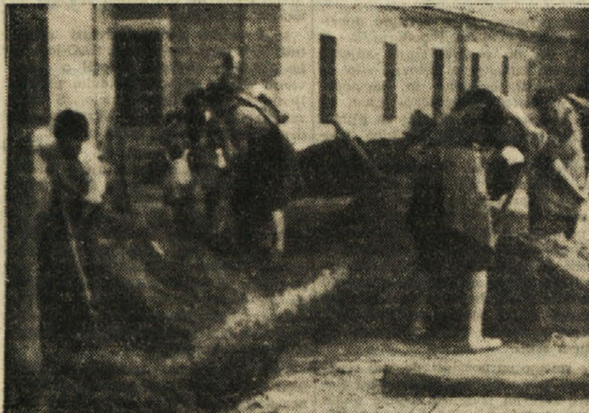
P.ostovoljci pri kopanju jarkov za vodovod

Na noben način pa niso taki primeri v prid vzgoji novih kadrov, ki bi jih bilo treba poučevati, ne pa nepravilno grajati. Res se pojavljajo napake pri mladih ljudeh pogosteje kot pri starejših, ker še niso popolnoma vpeljani v delo, res pa je tudi, da skušajo na vsakem koraku te napake odpravljati, ker imajo dovolj dobre volje za delo po novih preizkušanih načelih.