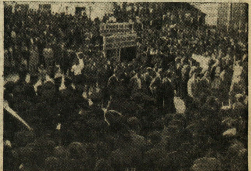
Manifestativno zborovanje ob priliki dosega polletnega plana

Potrebno je, da se spomnimo na to, ko danes še marsičesa primanjkuje, ko si še marsičesa ne moremo nabaviti. Ne mislim zagovarjati slabosti, potrebno pa je, da vam omenim tudi to. Kadar so v kapitalizmu najbolj polni magazini, kadar je produkcija na višku, takrat je največja brezposelnost in prav zaradi tega nastajajo gospodarske krize. Danes, ko vsa naša industrija, vsa naša proizvodnja, vsa naša gospodarska dejavnost stremi samo za ciljem, da se producira toliko, kolikor je treba za naše vodstvo, da se zadovoljuje potrebe, da se dvigne življenjski standard naših ljudi, se bo-