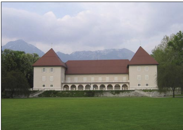
Na brdskom gradi gorprijajo tihinske delegacije

meğlé pa mraza nega, zatok se leko dale pelamo po svojoj pauti prauti vekšim varašom gorenjske krajine.