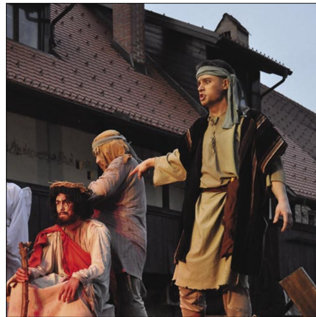
Kristušovo trpljenje, kak ga zašpilajo v Škofji Loki

Na kapucinskem mosti v Škofji Loki stogi kip Janeza Nepomuka, šteri s svojim prstom na lampaj kaže, ka moremo tüoma biti. Tüoma kak un, gda je nej sto krali ovaditi, ka ma je v