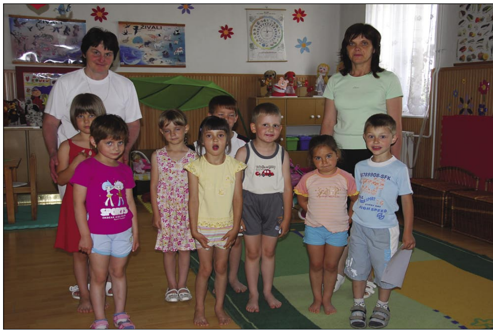
Zadnja (?) skupina otrok z vzgojiteljicama v Slovenski vesi

...Nekoč je bil nek vrtec; v krasni vasici, tako rekoč predmestju Monoštra, poln pozitivne energije, otroškega smeha in prijaznosti vzgojiteljic. Bil je narodnostni vrtec, torej inštitucija, kjer se je tako uradno kot neuradno slišala slovenska beseda, pač toliko, kolikor so jo govorile vzgojiteljice, kolikor so le-to učile vedoželjne malčke in kolikor so za učenje slovenščine bili zainteresirani starši. Ker je vrtec Slovenska ves samo enota centralnega monoštrskega vrtca, v katerem imajo le eno t. i. slovensko skupino malčkov (to je približno 10 % vseh vpisanih v vrtec), se je že pred letom dni obstoj slovenskoveškega vrtca uradno zaradi premajhnega števila vpisanih otrok postavil pod vprašaj. Vodstvo centralnega vrtca in monoštrska občina kot ustanovitelj sta z neznosno lahkostjo namerale in brez kančka poslušanja za pomen vrtca kot narodnostne inštitucije načrtovala njegovo zaprtje. Usklajena akcija predvsem slovenske samouprave, staršev in drugih zainteresiranih je – zdaj vemo – le podaljšala agonijo vrtca za leto dni... Pred časom se je začelo šušljati o, menda za-