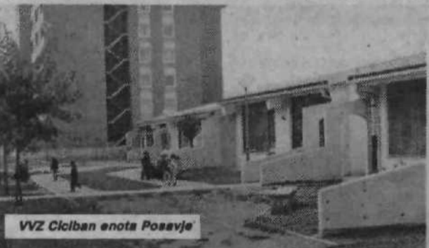
VVZ Ciciban enota Posavje