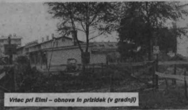
Vrtec pri Elmi - obnova in prizidek (v gradnji)