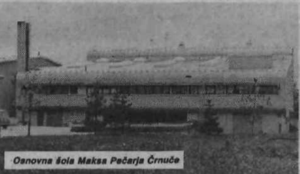
Osnovna šola Maksa Pečarja Črnuče