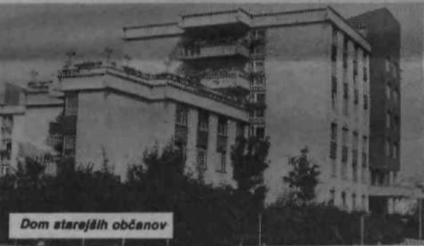
Dom starejših občanov