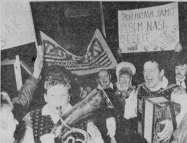
Navdušeni oboževalci narodnozabavne glasbe so se odpravili v Celje kot na kakšno nogometno tekmo, s transparenti, glasbili in veliko dobre volje. Najbolj glasna je bila skupina iz Mengeša - »evropskega glasbenega središča«.