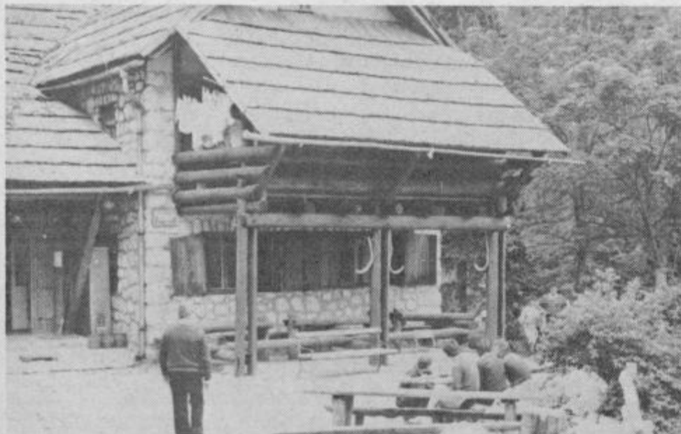
Prvoten planinski dom so leta 1962 dozidali, takole pa izgleda kočica sedaj. Na zunaj je kar lepo urejena, zato pa je znotraj toliko bolj potrebna obnove.

S sedanjo, tretjo obnovo doma so celjski planinci pričeli lani.