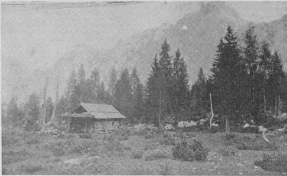
Prva planinska postojanka na Okrešlju, ki pa jo je plaz z Mrzle gore podrl in s tem pomagal slovenskim planincem, da so lahko na Okrešlju postavili svoj planinski dom. Fotografija je iz leta 1900.

V letih 1927–30 je bil dom prvič obnovljen. Pravzaprav so računali, da bo obnova