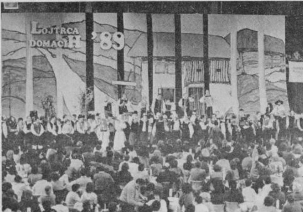
Dvorana Golovec je bila polna na obeh predstavah, kar dokazuje, da jo lahko napolni samo še narodnozabavna glasba.