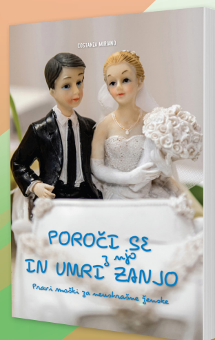
Costanza Miriano Poroči se z njo in umri zanjo Pravi moški za neustrašene ženske