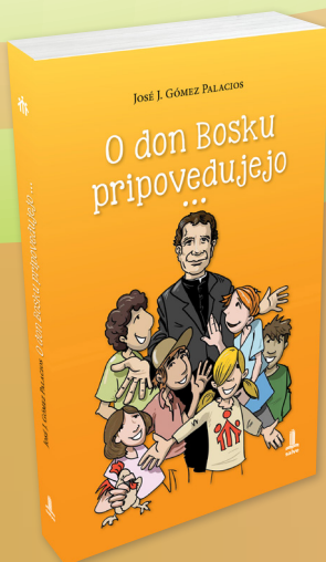
José J. Gómez Palacios O don Bosku pripovedujejo ...

Knjižne novosti prinašajo uspešnice znanih avtoric, ki spregovorijo brez dlake na jeziku, ne manjka pa niti novosti za mlade in otroke.