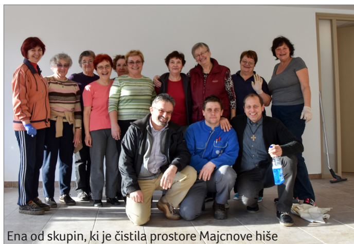
Ena od skupin, ki je čistila prostore Majcnove hiše