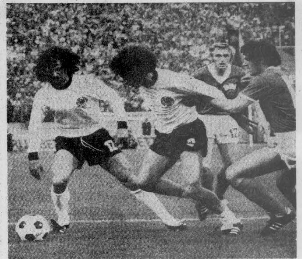
V ELEMENTU. Paul Breitner je igral v reprezentanci ZRN, ki je leta 1974 osvojila svetovno prvenstvo. Na sliki: Breitner v gneči med tekmo s NDR, ki so jo zahodni Nemci tedaj presenetljivo izgubili z 0:1.

Ce se bodo želje in napovedi slavnega šprinterja uresničile, tedaj bo nastop štiri Quarriejev v Moskvi 1980, klub bogati večdesetletni olimpijski zgodovini, nekaj posebnega, enkratnega.