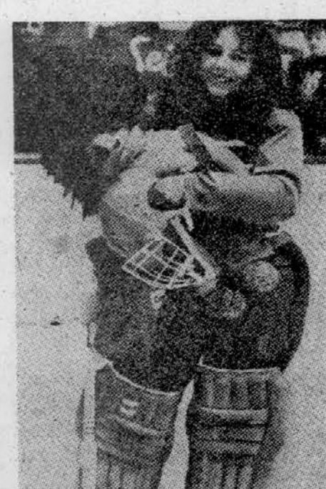
BOOM ZENSKEGA HOKEJA TUDI V EVROPI — V Münchnu sta pred dnevi tudi prvič igrali ženski hokejski vrstniki: Flüssen je premagal Rosenheim z dvoletnim rezultatom.

Boom na ledu je spravlil na tržišče tudi tovarnarje: ponujajo zaščito za prsi in ženske hlačke vseh velikosti. Letos poleti bodo organizirali tudi prvi skupni trening in priprave za dekleta in ženske na univerzi Guelph.