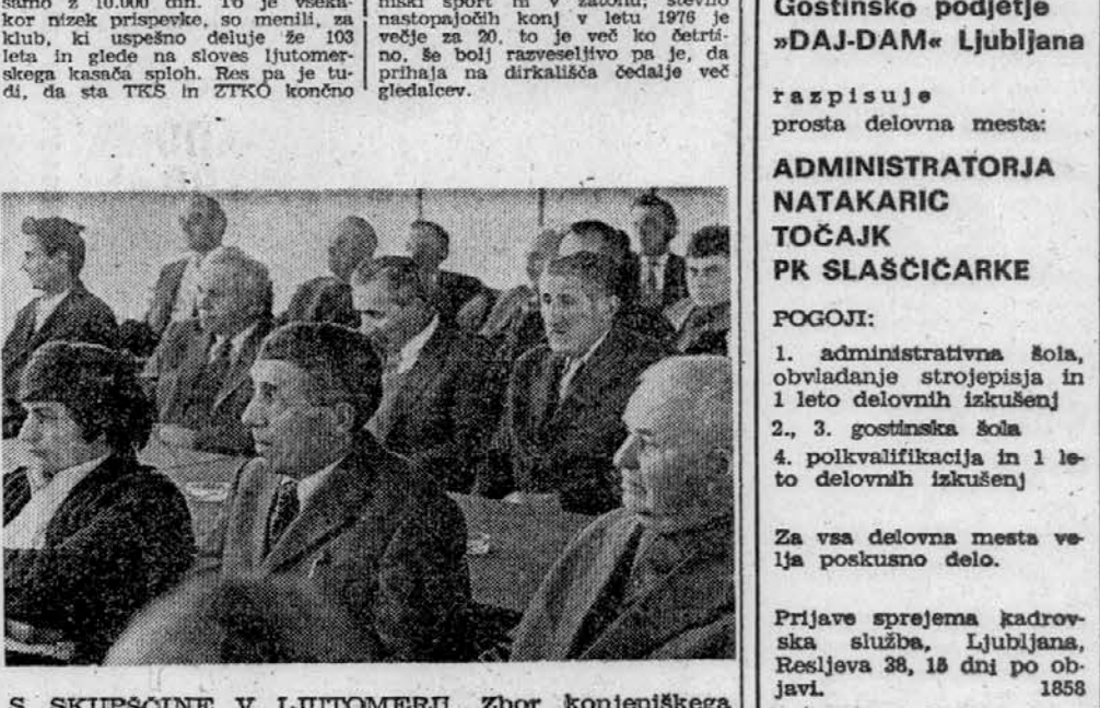
S SKUPŠČINE V LJUTOMERU. Zbor konjeniškega kluba je vzbudil veliko pozornost.