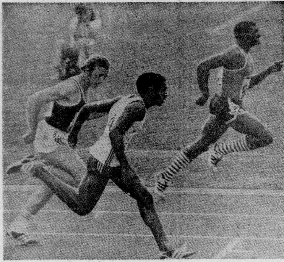
FINIS V MONTREALU. Tek na 100 m je na lanskih OI v Montrealu dobil Crawford (Trinidad) pred Quarrijem (Jamajka) in Borzovom (Sovjetska zveza).