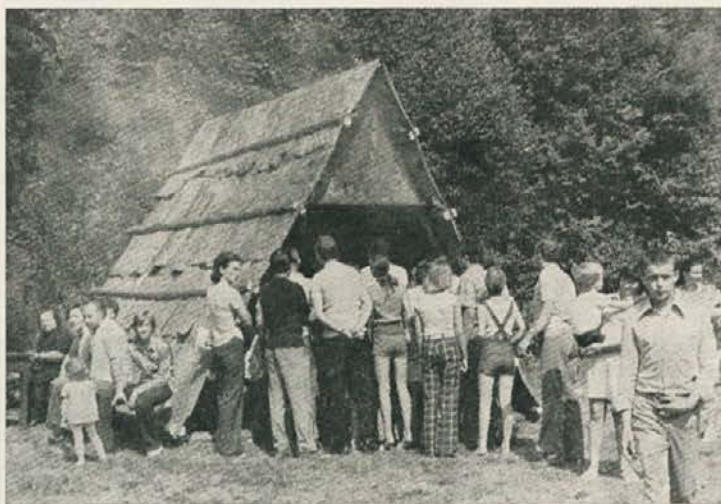
Holcarska bajta iz ljubja je bila še posebno vabljiva za tiste, ki so si hoteli tešiti lakoto s polento