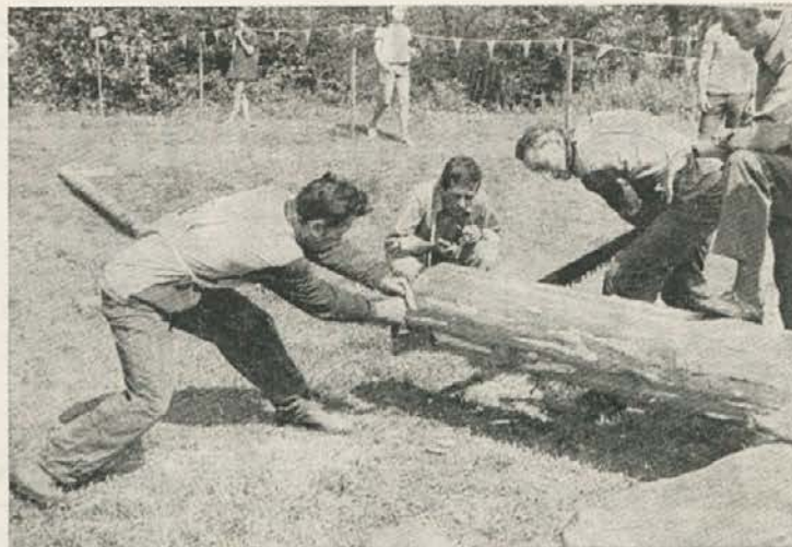
Pomerili so se tudi v ročnem prežaganju