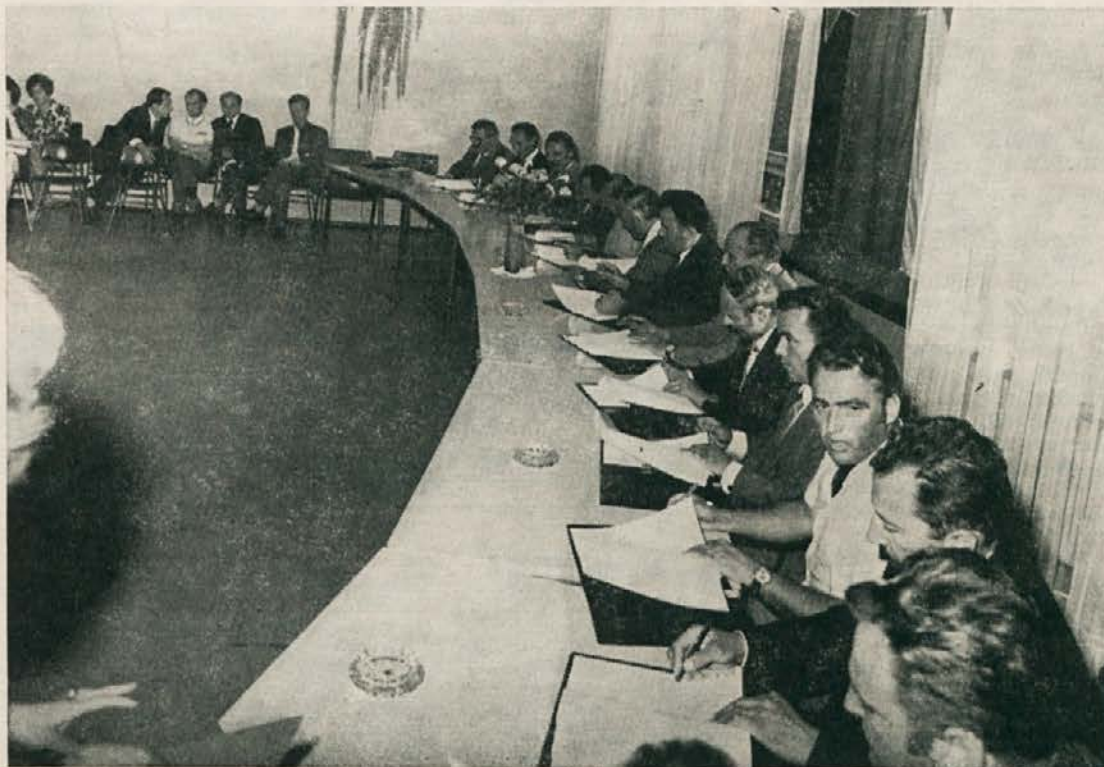
Dne 6. septembra 1973 ob 17. uri je bil v sejni sobi LIP Slovenj Gradec svečani podpis samoupravnega sporazuma o združitvi TOZD Gozdnega gospodarstva in Lesno industrijskega podjetja Slovenj Gradec