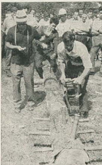
Obvežitev debla. Tu so se gledalci najraje zadrževali

Franc Obretan: Pri GO Črna delam že več ko 12 let. Začel sem pri očetu, ko še nisem bil star 18 let. Belih rok nimam. Mislim, da je v gozdarstvu potrebno predvsem paziti na dobro orodje, vzdrževanje mo-