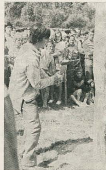
Ciljanje s sekiro

Ekipno je tako zmagal revir Orožija, drugi je bil revir Bi-