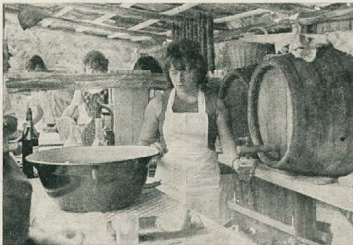
Savinjski želodec, domača salama, ržen kruh in krigel mošta so gotovo najbolj teknili marsikateremu obiskovalcu. Posebno še, če je z njim postreglo tako brhko koroško dekle, kakršno smo ujeli tudi mi