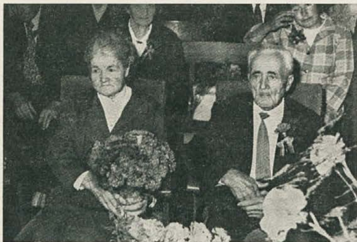
Vztrajati! To je bilo geslo