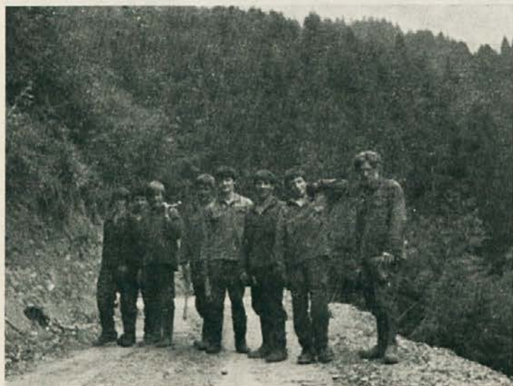
Zelimo jim uspešno delo