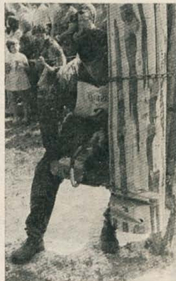
Podžaganje debela

Gozdovi so narodno bogastvo. Poleg velike vrednosti, ki jo predstavlja les kot surovina, imajo še drugo zelo pomembno družbeno vlogo: regulirajo vodni režim, varujejo naselja pred viharji, so zelo prijetni za rekreacijo itd. Čuvajmo gozdove pred požari!