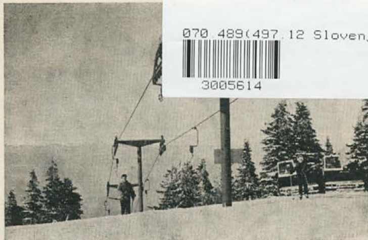
Največja vlečnica v Evropi, zgrajena na Mali Kopi

Z razvojem mehanizacije je delo postalo nevarnejše, terja več koncentracije in pazljivosti.