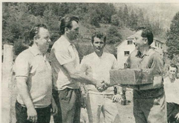
Podelitev nagrad trem najboljšim