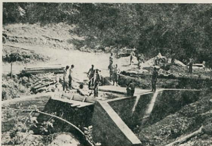
Na gradbišču mosta pri Libeličah