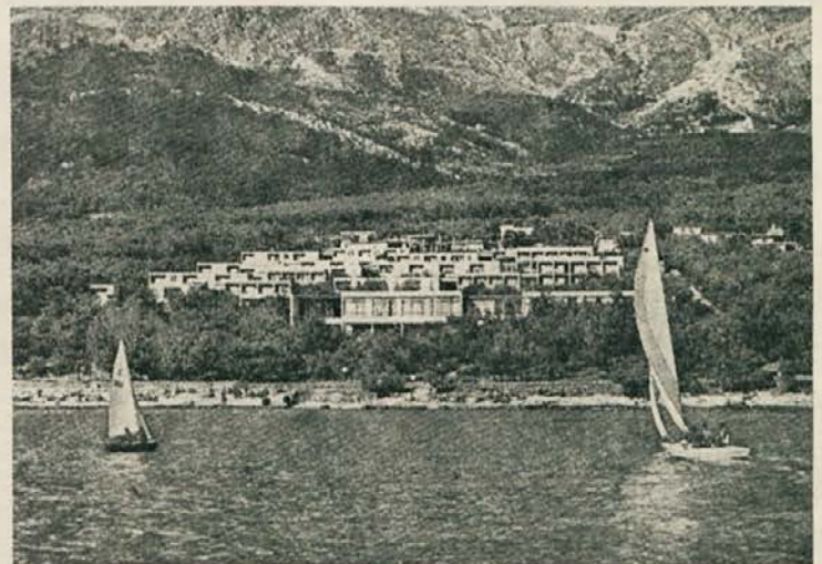
Makarska — kolektiv TOZD skupnih služb je bil na izletu

Športna panoga, ki je na območju Koroške skoraj še ne poznamo, je judo. Ta vzhodnjaški šport se je najprej pojavil v budističnih samostanih, nato se je po nekaj stoletjih mirovanja razširil na zahod, v Evropo, kjer je žel velik uspeh.