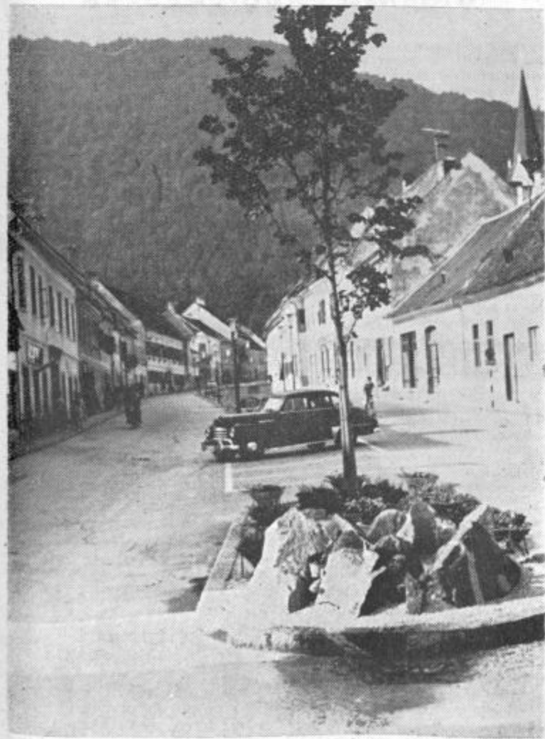
Motiv iz Slovenskih Konjci

S prehodno klavnico bo omogočena higienska priprava mesa za potrošnjo. Ker ima dosežena klavnica v Sentski Jurji nekatere pomanjkljivosti, bo prehodna klavnica pri hladilnici prevzela njeno funkcijo vse do izgraditve velike klavniške obrata v bližini Celje.