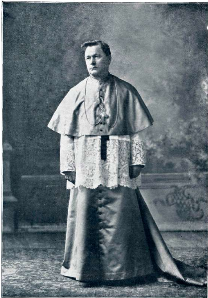
ŠKOF IVAN STARIHA

Kovač je koval dalje, kakor da ni bil slišal, a slišal je bil dobro in je razumel.