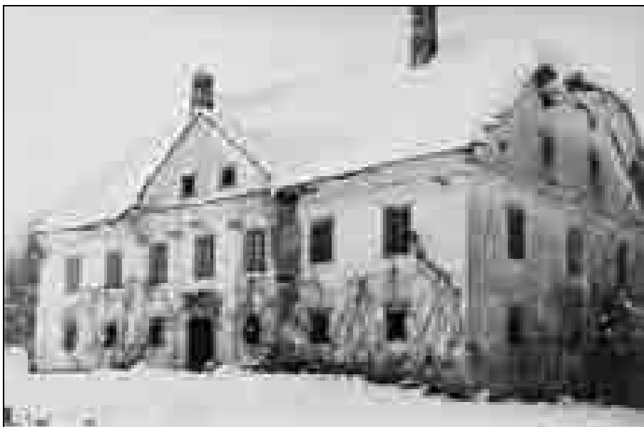
Pogled na južno glavno fasado, fotografija.