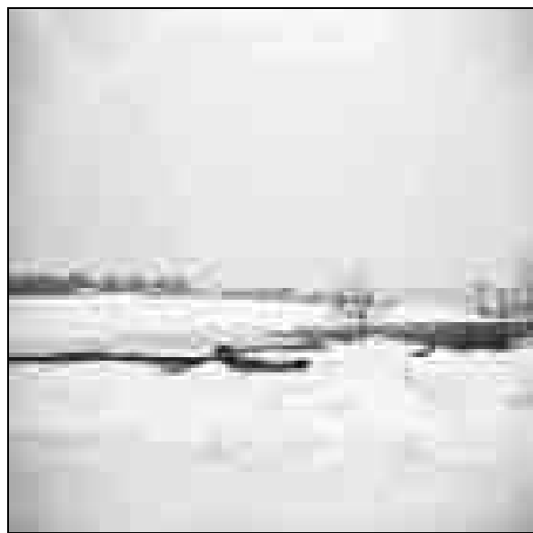
Grumlofska krajina z graščino v ozadju, fotografija.