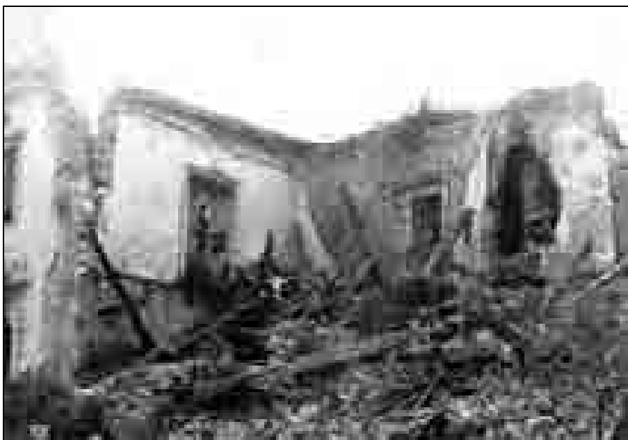
Pogled na notranje zidove z jugovzhodne strani, 1974, fotografija.

Preden je obiskovalec vstopil v grad, je moral s tolkačem, okrašenim z inicialkami prvega lastnika, potrkat na velika hrastova vrata. 43 To je moral na-