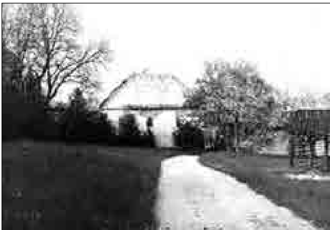
Graščina Grumlof leta 1974, fotografija.