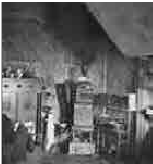
Atelje Ferda Vesela, grad Grumlof, ok. 1939, fotografija (vir: Narodna galerija, inv. št. NG D 512-9).