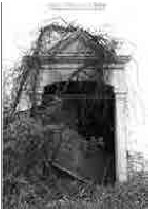
Pogled na portal, 1974, fotografija.