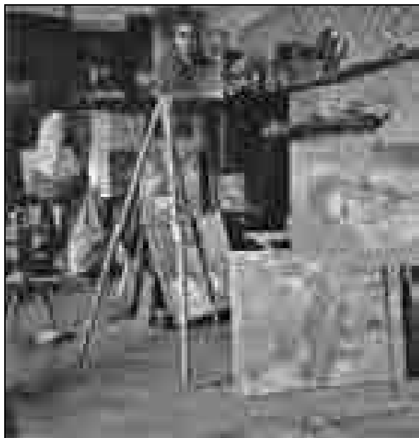
Atelje Ferda Vesela, grad Grumlof, ok. 1939, fotografija (vir: Narodna galerija, inv. št. NG D 512-8).

je učitelju priskrbel radio, ker pa ta denarja ni imel, sta se dogovorila, da bo učencu stroške povrnil s sliko. 47 Vedno ko je beseda nanese na obljubljeni