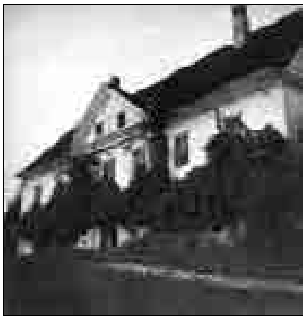
Pogled na južno glavno fasado okoli leta 1949, fotografija.

čelje so krasila v nadstropju dokaj velika, v pritličju pa nekoliko manjša okna v profiliranih kamnitih okvirjih. Osrednji del fasade je monumentalno izstopal z navideznim rizalitom z dvema paroma pilastrov, ki so uokvirjali segmentno sklenjen glavni portal z vklesano letnico 1811 in nosili profilirano gredo, nad katero je bilo trikotno atično čelo z mansardnima okencema s krožnico. 39 Grajske stene so bile debele in delno poslikane. Poslikani so bili tudi nekateri ometani ravni stropi v prvem nadstropju. 40 Umetnik je bival v prvem nadstropju, kjer je imel več velikih, visokih in zračnih sob. Če je imel odprta vrata, je lahko gledal iz prvega v zadnji prostor, dolžina te razdalje pa je znašala natanko 33 metrov. Veselovi predhodniki, ki so na začetku 19. stoletja zgradili grad, so imeli velik občutek za monumentalnost in svetlobo, predvsem slednje je bilo vseh tudi Veselu: »Če bi imel ta grad v Ljubljani, bi se počutil v devetih nebesih. Tak atelje bom težko dobil v Ljubljani.« 41 Med drugo svetovno vojno pa se je Vesel zaradi starosti in nezaupljivosti do ljudi preselil v pritlične sobe svojega propadajočega gradu. 42