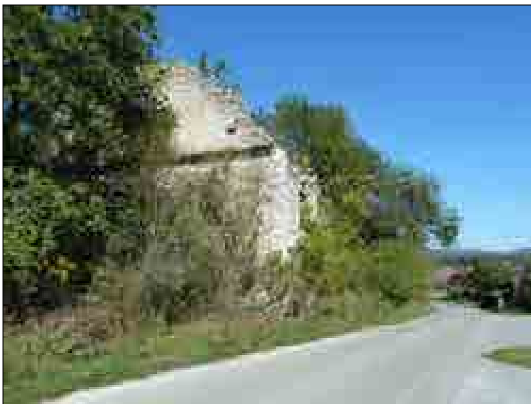
Graščina Grumlof, današnje stanje, fotografija.