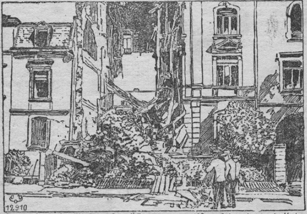
Die „militärischen“ Erfolge Feindl. Bombenangriffe auf das deutsche Heimatgebiet: Bombentreffer in einem Privat-Wohnhaus in Darmstadt.

Prešteti te misli, naprošamo Vašo ekscelenco, blagovolite o priloženem besedilu note obvestiti Njegovo Svetost.“